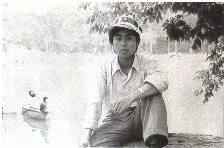
海子在北大未名湖畔