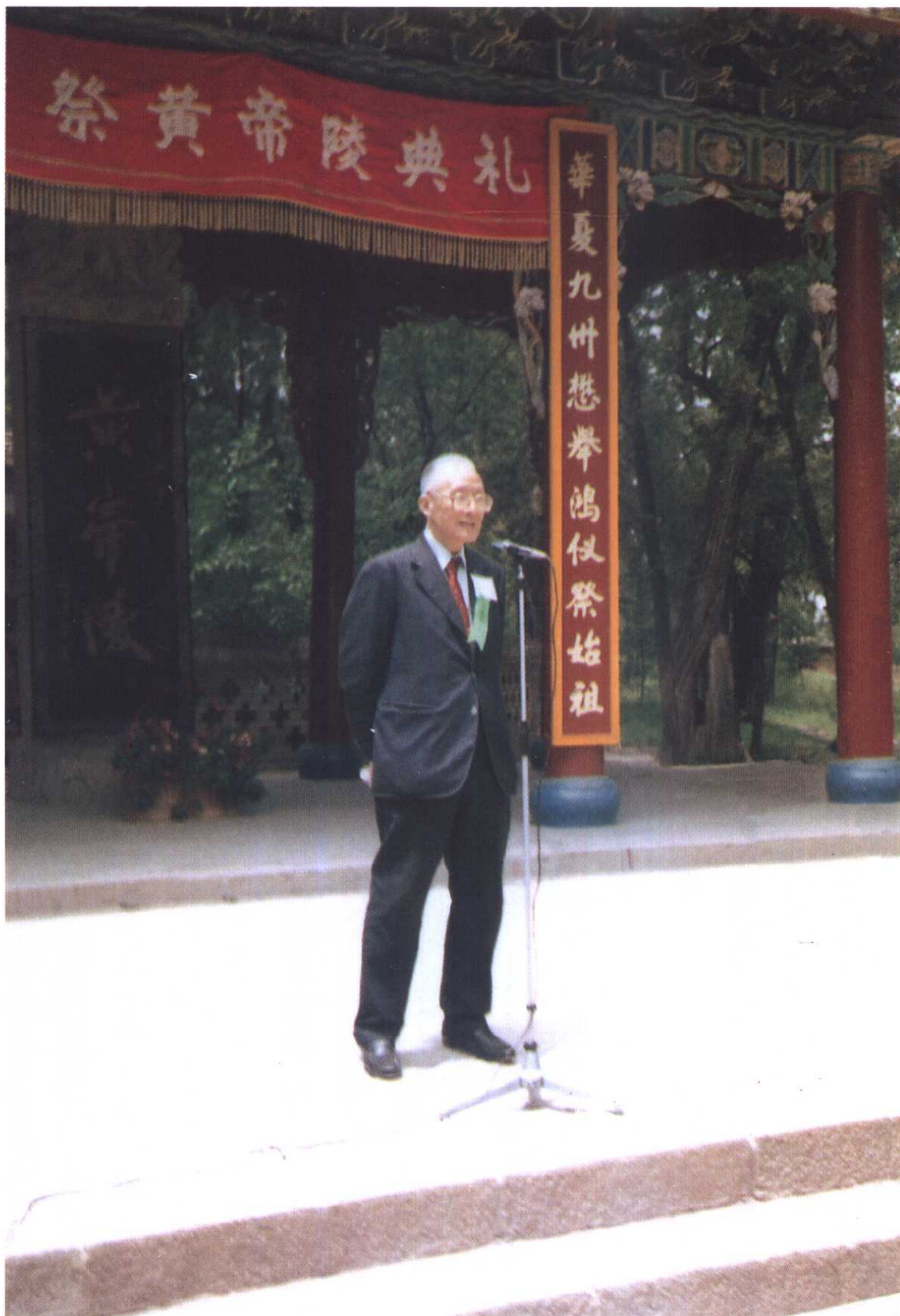
◎顾毓琇先生谒黄帝陵（一九八六年六月）