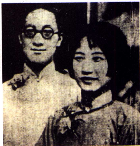
徐志摩与陆小曼 (1926年，北京)