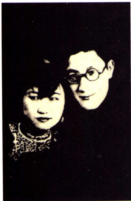
徐志摩与陆小曼摄于蜜月 (1926年，北京)