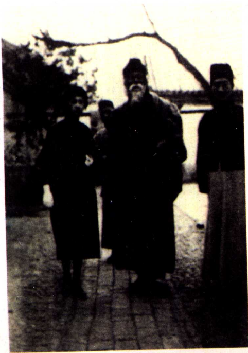
徐志摩与林徽因，中立 者为印度诗人泰戈尔 (1924年，北京)