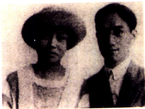
徐志摩与张幼仪（1921年，巴黎）