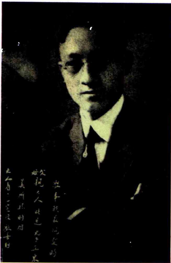
徐志摩像 原刊1936年《爱眉小札》初版本