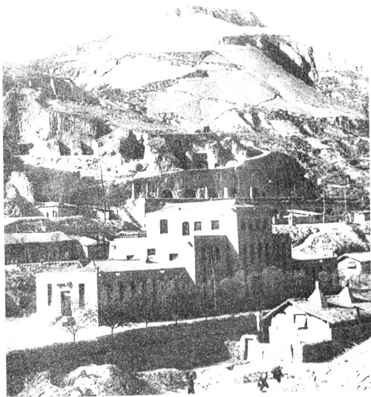
延安杨家岭（一九四二年吴印咸摄）