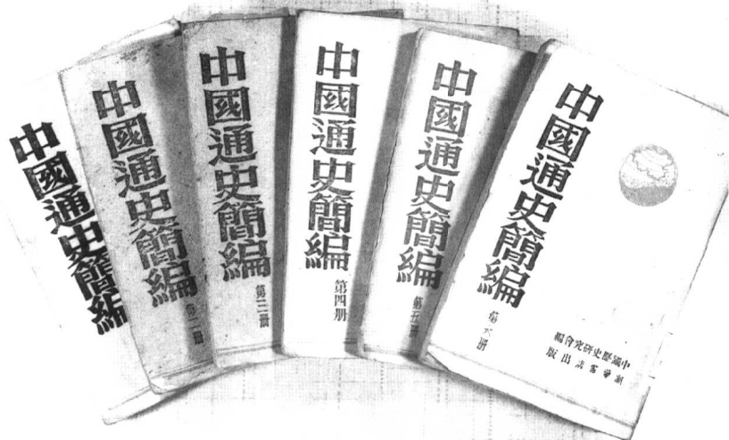
一九四三年新华书店六卷本《中国通史简编》书影