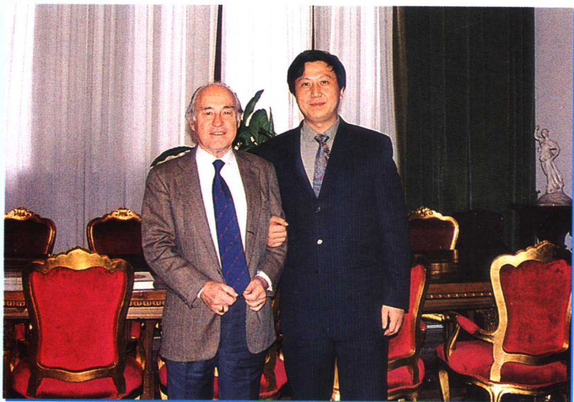
作者与意大利总检察长法瓦拉合影 2002年12月6日