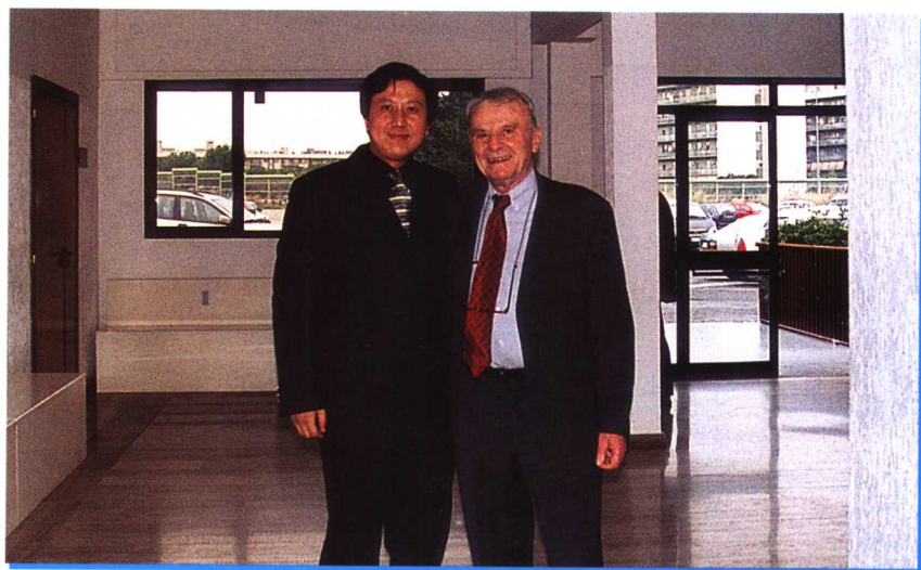
作者与意大利反黑手党总局局长彼耶罗·路易吉·维尼阿合影 2002年12月16日