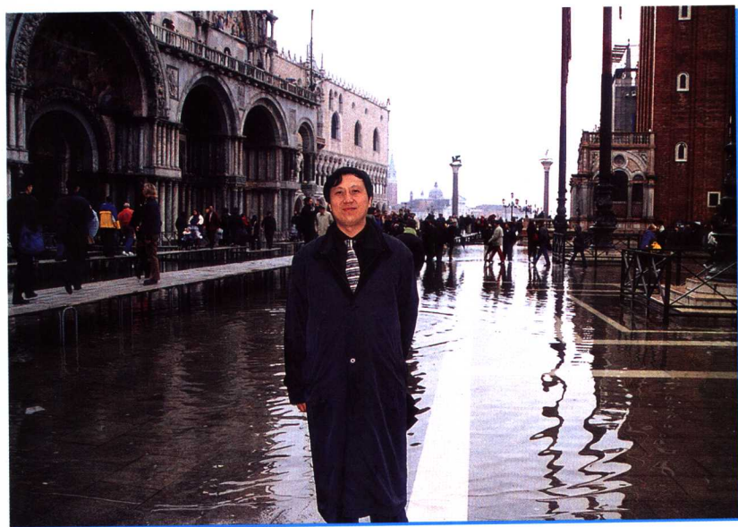
作者在万神庙前 2002年11月20日