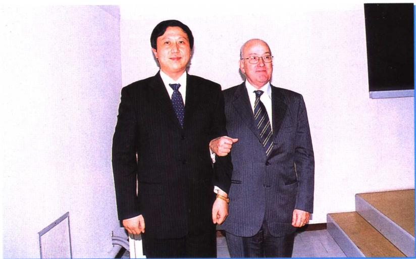
作者与罗马大学校长阿莱桑德罗·阿格里合影 2002年12月8日