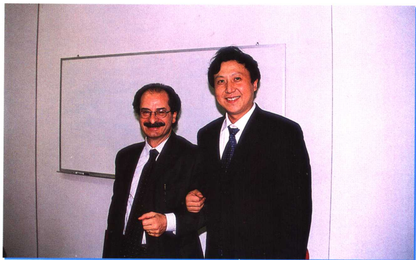
作者与意大利共产党总书记、众议员、 前司法部部长奥利维洛·第利贝尔托合影 2002年12月16日