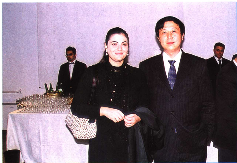
作者与司法部副部长桑迪莉合影 2002年12月8日