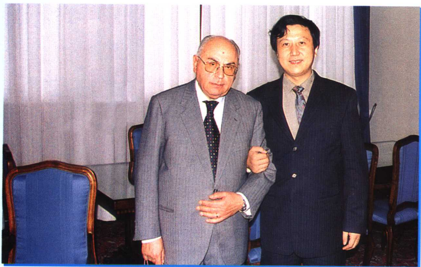
作者与意大利最高法院院长马尔乌利合影 2002年12月6日