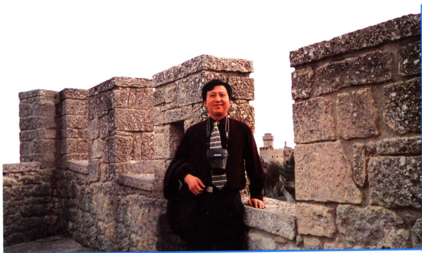
作者在圣马力诺城堡上 2002年11月18日