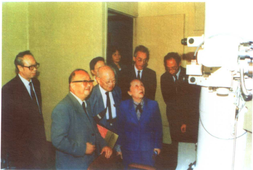
1988年，冯端陪同吴健雄参观南京大学物理系固体微结构实验室