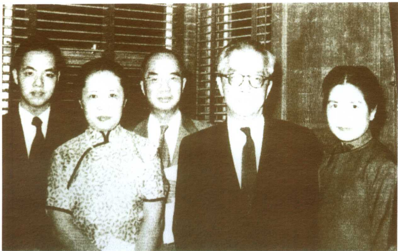
早年，吴健雄与胡适(右2)等人合影