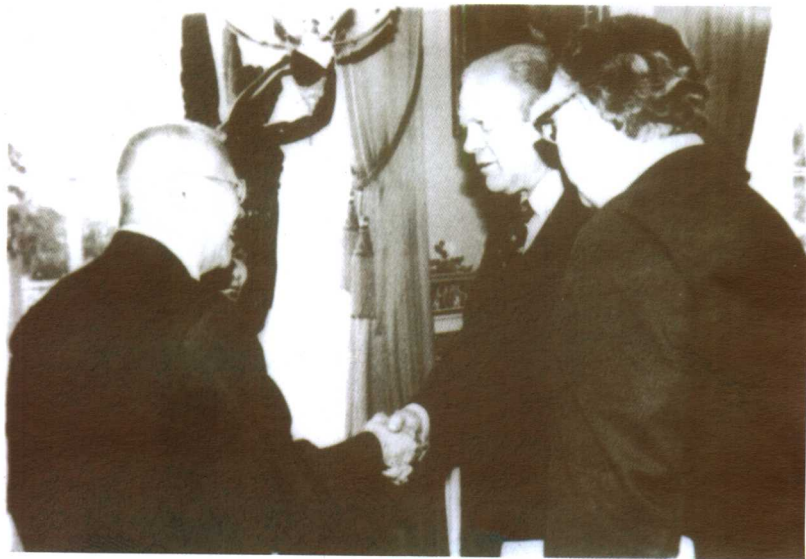
1975年，美国福特总统会见袁家骝