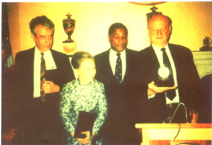
1986年，美国纽约市长柯赫(右1)向吴健雄颁发科学技术贡献奖