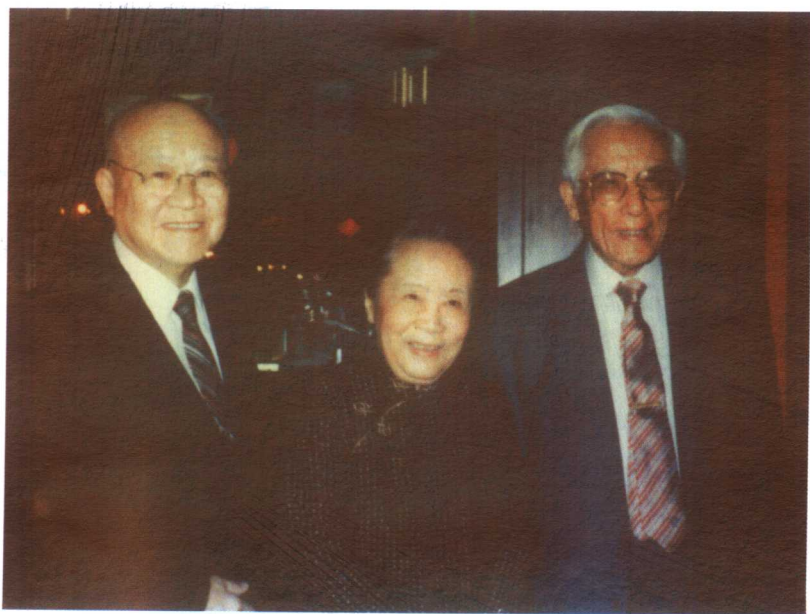
1987年，吴健雄、袁家骝与赴美访问的周培源合影