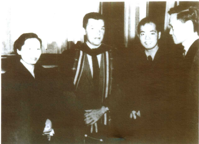
1957年，美国普林斯顿大学校长戈亨授予吴健雄、杨振宁、李政道荣誉科学博士