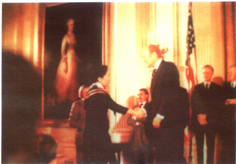
1975年，美国福特总统授予吴健雄美国国家科学勋章