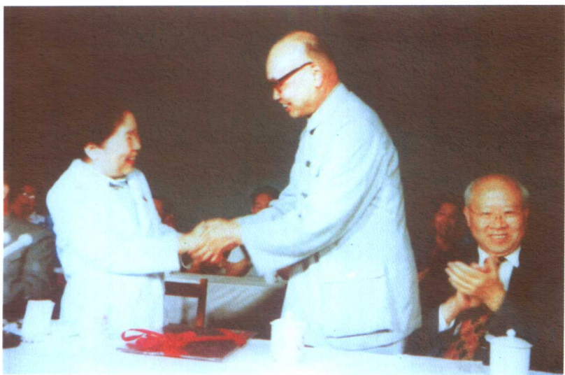
1982年，南京大学匡亚明校长授予吴健雄名誉教授称号