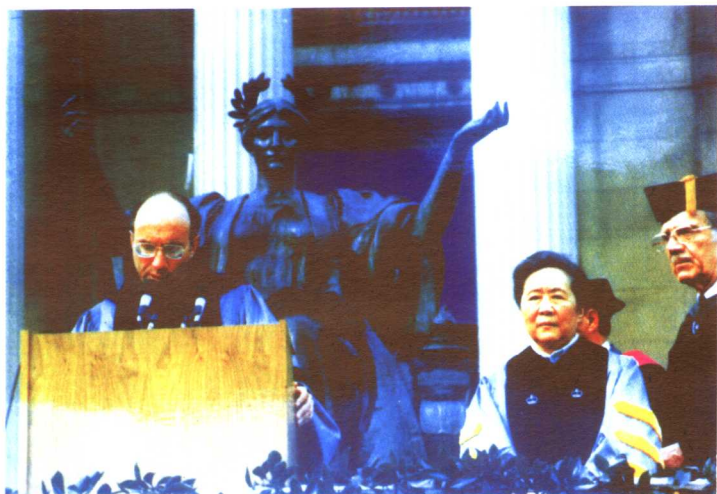
1972年，美国哥伦比亚大学校长授予吴健雄“普平教授”称号