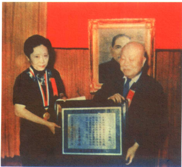
1965年，吴健雄获台湾嘉新特殊贡献奖