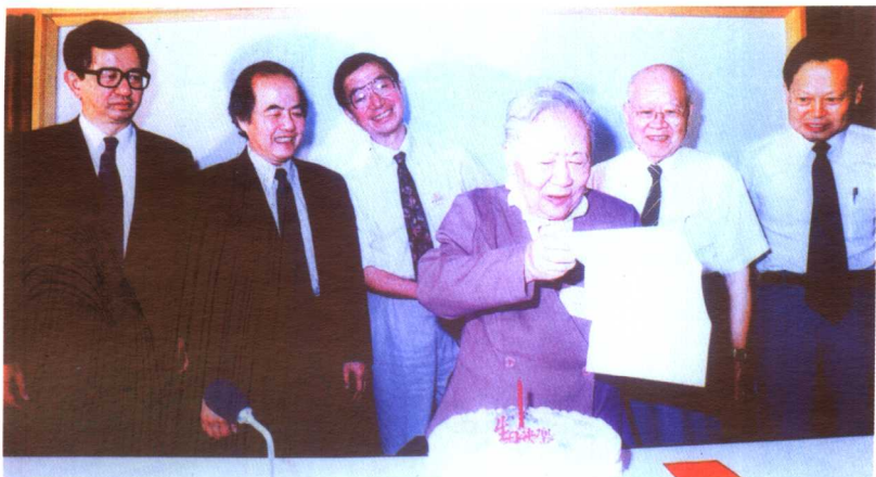
4位诺贝尔奖获得者发起“吴健雄学术基金会”，向吴健雄祝寿 (从左至右:李远哲、李政道、丁肇中、吴健雄、袁家骝、杨振宁)