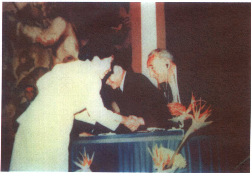
1978年，吴健雄获“沃尔夫奖”时与沃尔夫握手