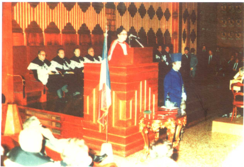
1984年，吴健雄在意大利帕度亚大学获荣誉博士，并在当年伽利略讲座的大厅中演讲