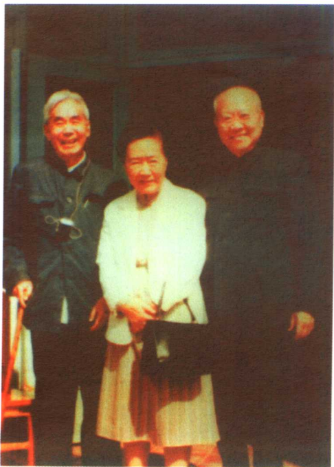
20世纪80年代初， 吴健雄、袁家骝探望 张文裕