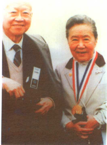
1986年，吴健雄获“爱丽丝岛奖章”后与袁家骝合影