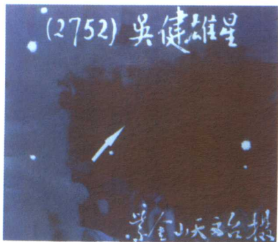
1990年，南京紫金山天文台命名2752星为“吴健雄星”