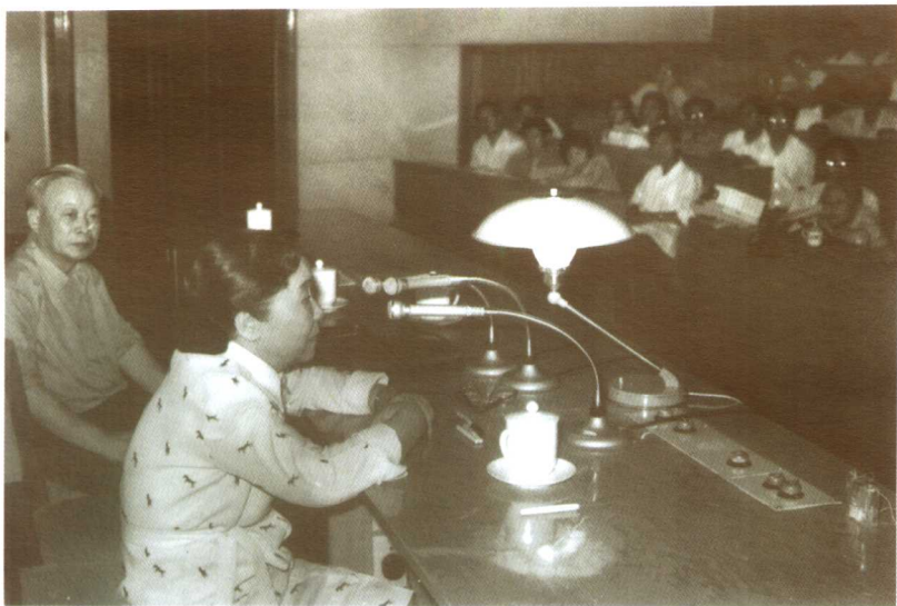
1982年6月26日，吴健雄应邀在北京作《宇称不守恒之发现》的学术报告