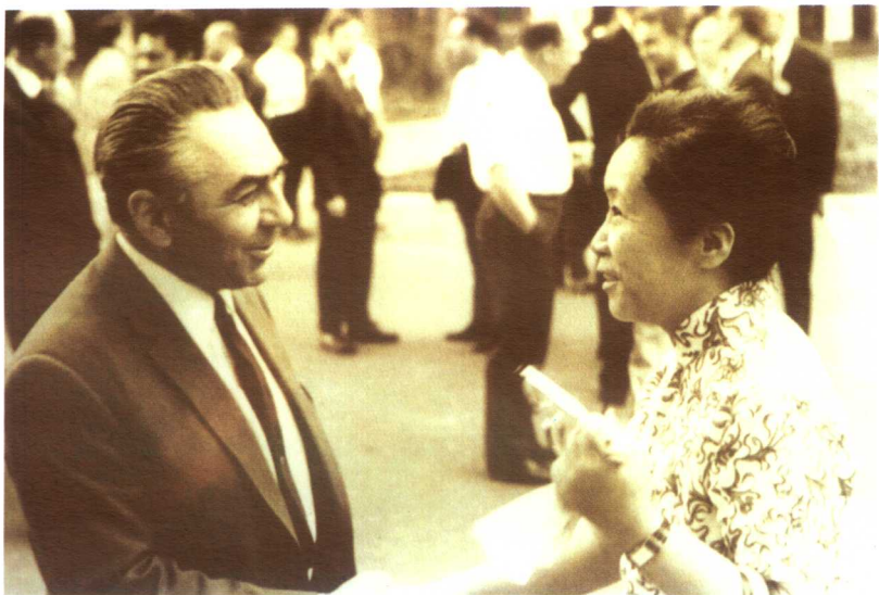
1967年，吴健雄在Dubna参加学术会议期间与著名科学家 ДЖЕЛЕПОВ交谈