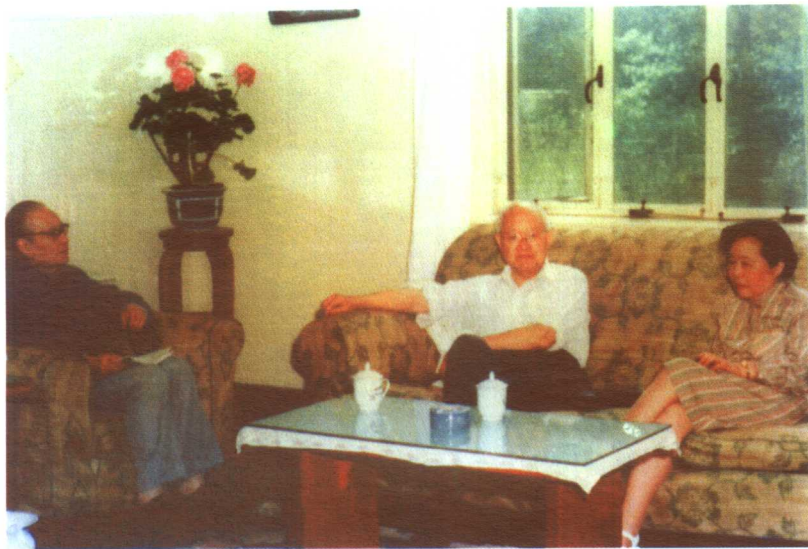
1982年，吴健雄、袁家骝与魏荣爵在一起交谈