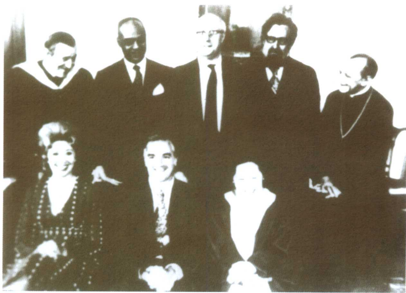
1974年，美国哈佛大学授予吴健雄荣誉学位后，校长与吴健雄及其他受奖者合影