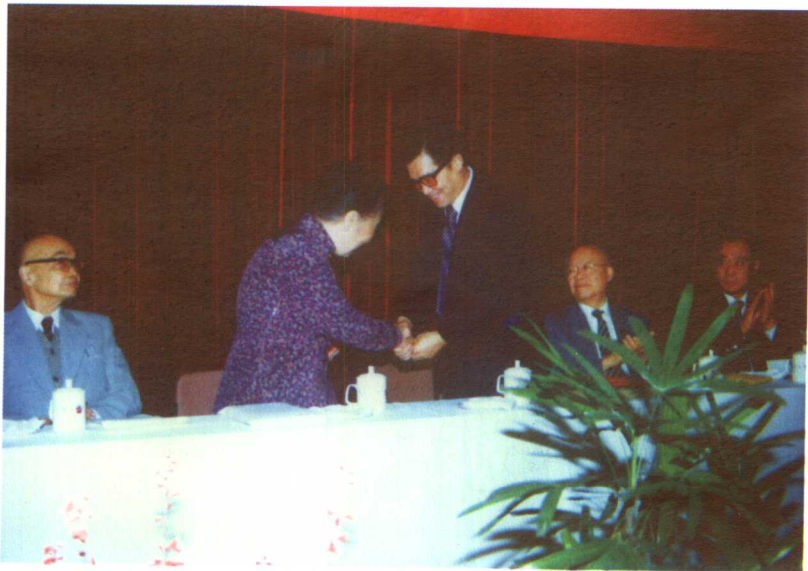
1986年，南京大学授予吴健雄、袁家驹名誉博士学位证书