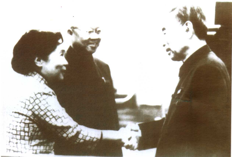
1973年，吴健雄、袁家骝第一次回国时，受到周恩来总理的亲切接见