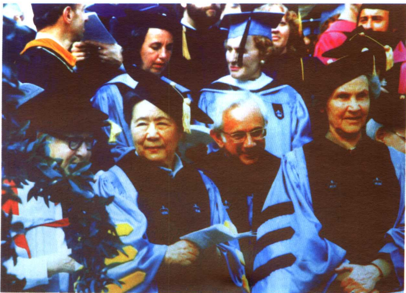
1982年，美国哥伦比亚大学校长梭汶给吴健雄等人颁发荣誉博士学位后留影