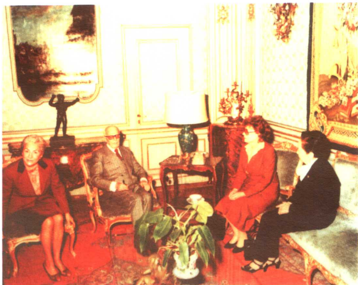
1981年，吴健雄(右1)在罗马接受“文森特奖”，受到意大利总统(左2)的接见