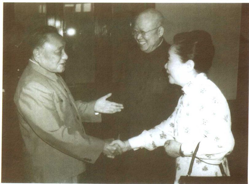
1984年9月19日，邓小平会见吴健雄、袁家骝