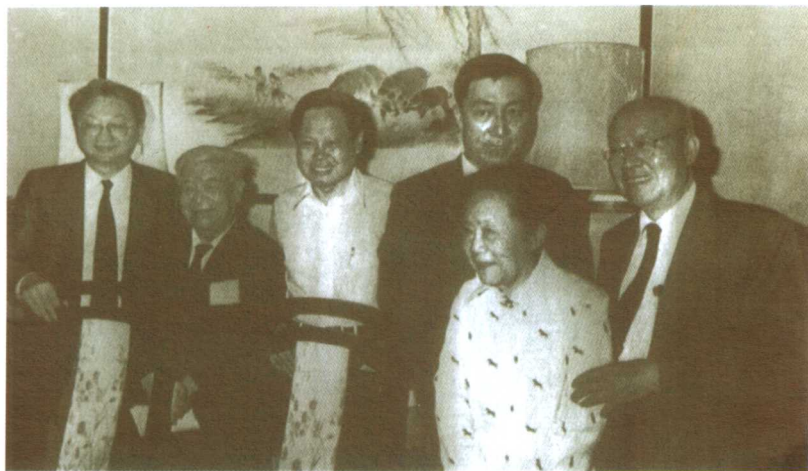
1986年7月31日，杰出物理学家聚会台北，研究设立“丁肇中奖学金”问题(从左至右:奖学金的捐助人刘永龄和杰出物理学家吴大猷、杨振宁、丁肇中、吴健雄、袁家骝)