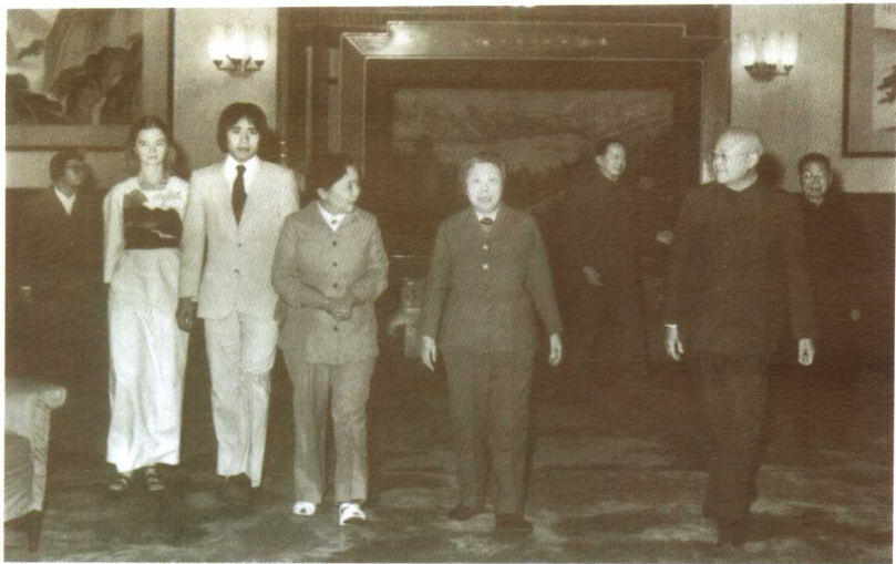
1977年10月10日，邓颖超副委员长会见吴健雄、袁家骝，以及他们的独生子袁纬承和儿媳露西。