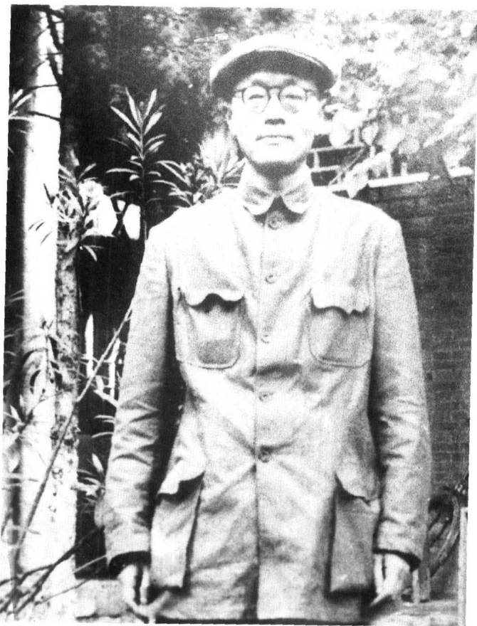
抗日战争初期留影