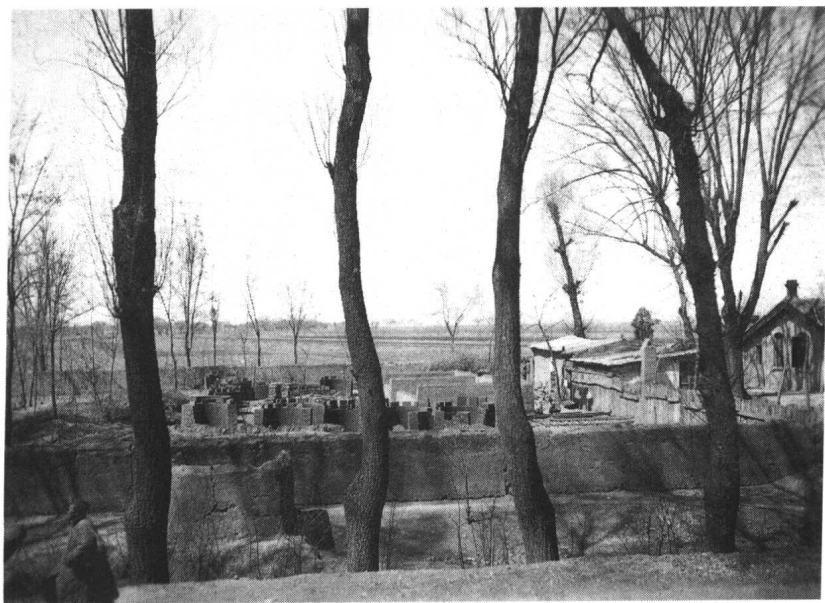
20世纪30年代的平教会所在地——河北省定县翟城村