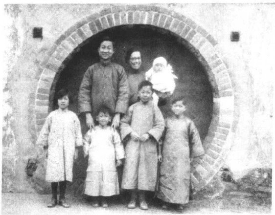
晏阳初一家在定县