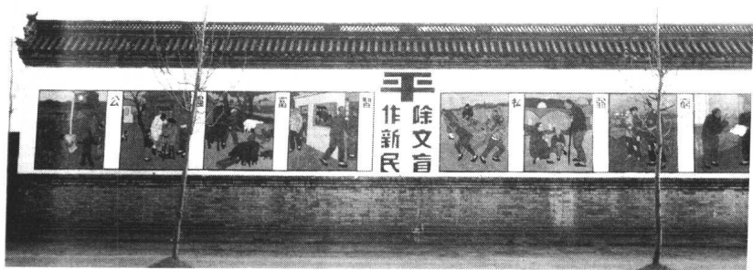
用农民看得懂的方式办教育

家才能富。看起来这很简单，真理却存在其中。我们今天要相信的就是‘民为邦本，本固邦宁’，我们应该努力的是固本的工作。”晏阳初说：“中国有金矿、煤矿，这矿那矿，但最重要的还要重视开发‘脑矿’，‘世界最大的脑矿在中国’，‘要充分发掘劳动人民的潜在力’，把十亿人民的脑矿开发出来就是对人类最大的贡献。知识分子必须深入民间，到群众中去，‘博士下乡’，为民众服务。”