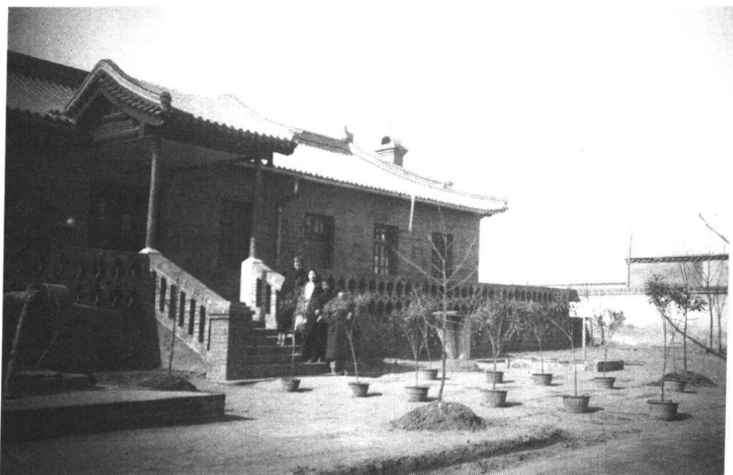
定县平教会会址原貌