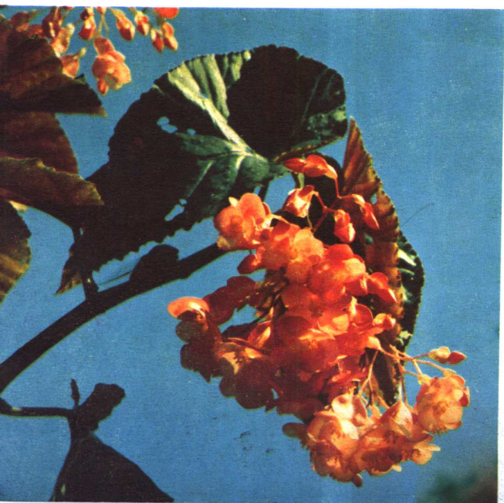
秋 海 棠