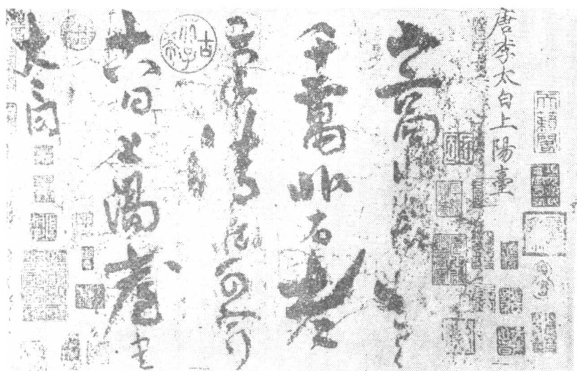
李白 上阳台台诗稿