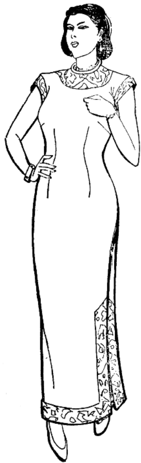
图1—5 近代妇女穿着的改革式旗袍

新中国成立以后，我国时装的发展有过三个高峰时期。第一个时期是1955—1957年，由于当时政治、经济状况都比较稳定，人们对美的追求也日益强烈，中国服