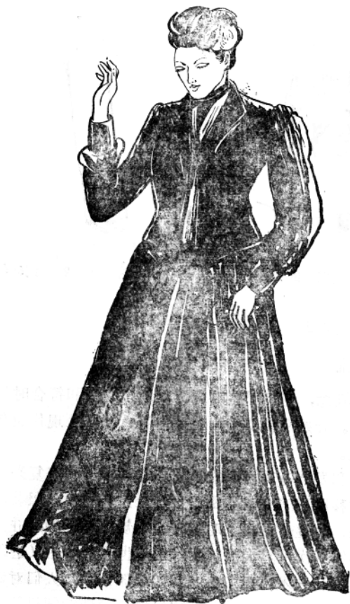
图1—10 1902年风行的“吉布森少女装”

子的青睐，它主要表现为20世纪初期以法国巴黎为中心的现代时装模式和以美国成衣业发展的新潮流。1914年，随着第一次世界大战的爆发，造成了巨大的冲击波，使服饰由过去古老的紧身束腰、曳地长裙走向了简洁、高雅、多变层次的新颖时装，从1902年风行的“吉布森少女装”（图1—10）到1910年美国舞蹈家爱莲素带至欧洲的“青年派时装”，都是那个时期的代表作（图1—11）。1919年第一次世界大战以后，时装逐步波及到欧洲，并渐渐东移和向南延伸，在西亚、阿拉伯半岛、南亚、印度半岛以及中国、甚至非洲的土地上，时装与当地的风土人情、民族特点和社会风貌融为一体，形成了迎合时代新潮流的新颖服饰。我国时装的发展就是从那时开始的，首先出现时装雏形的是在沿海通商城市，如上海、天津、广州、青岛等地。从20世纪10至20年代由中国人开设的“洋服店”、“时装店”已与日俱增，他们设计的服装一改以往中国服装的平面剪裁结构，出现了立体块面组合结构的西洋剪裁结构和工艺加工，在款式上面貌全非，确是一派时装风度。但那时由于国民党政府的腐败，民不聊生，广大劳动人民对时装只能望尘莫及，同时也带来了时装界的表面繁荣和内在危机。只有今天，做为时代标志的时装才真正成为人民的需要，为人民享用，使中国民族的时装与国外流行时装作为中外文化艺术交流的一部分成为可能，并且这种交流在日益加强，从而开创了中外时装交流和贸易的新局面（图1—12）。