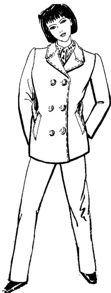
图1—9 20世纪50年代流行的人民装