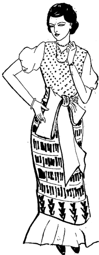
图1—8 20世纪40年代妇女的西式礼服