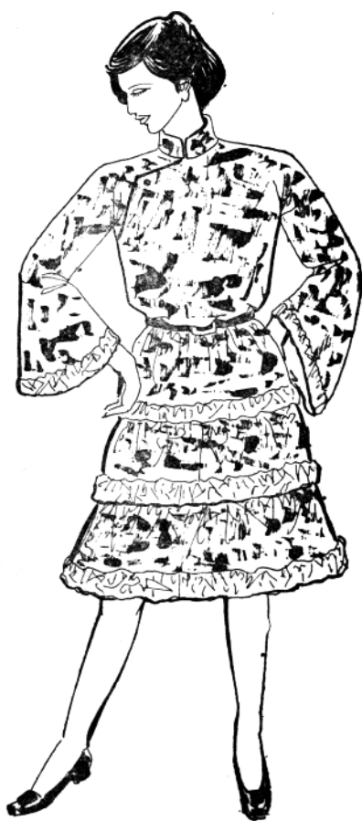
图1—7 20世纪20年代的旗袍领连衣裙

装与苏联、东欧各国的服装交融一体，时装发展出现了崭新的局面(图1—9)。第二个时期是1964—1966年初，中国服装出现了民族化、大众化、时装化和美化的良好开端，特别在服装的款式设计、面料设计、工艺加工等方面都有新的突破。第三个时期是即粉碎“四人帮”、特别是党的十一届三中全会、1970年以后，中国服装已逐步纳入了国际时装发展的轨道，出现了持续期最长、内容最丰富的“时装新潮”期，反映了当代中国人的伟大精神面貌，开创了中西合璧时装发展的鼎盛局面。