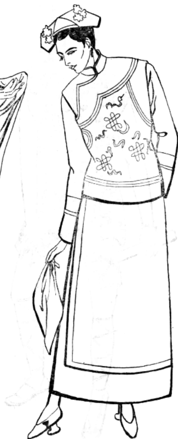
图1—4 清朝旗袍、马甲服饰