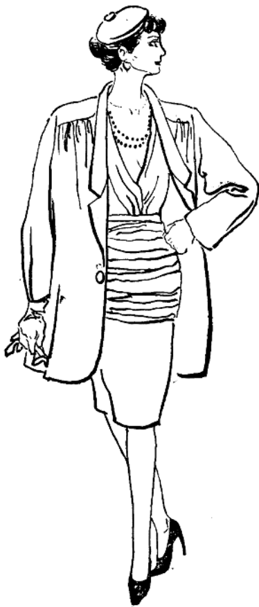
图1—12 1986年流行的长西装套装