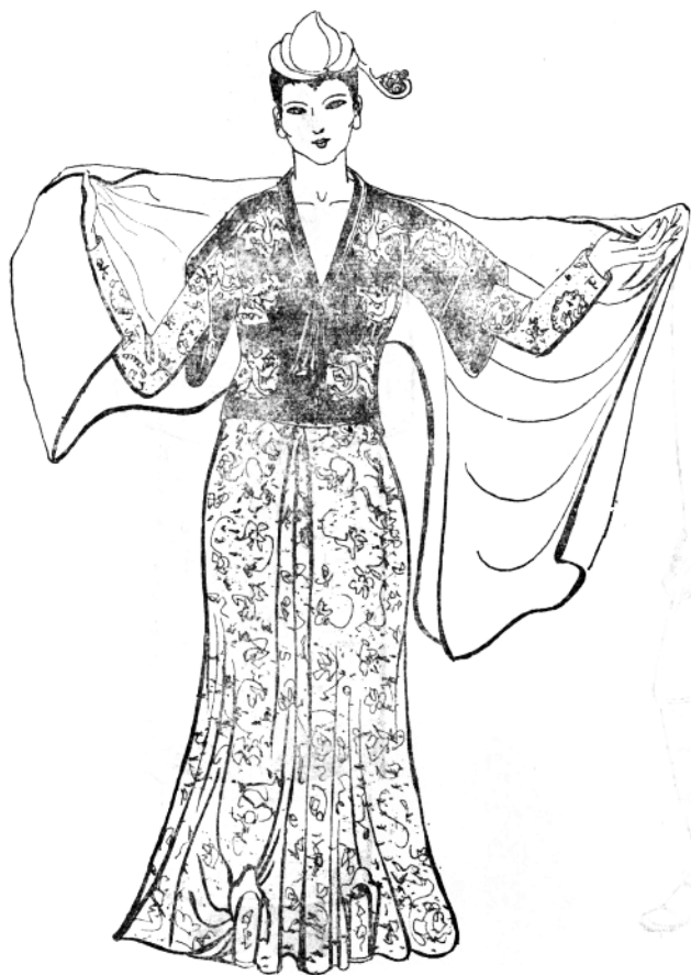
图1—3 唐代女子华丽的服饰

中国是一个多民族的国家。中国的历史，是各族人民共同普写的历史，中国的服饰也是各族人民共同创造的服饰。早在两千多年以前，中原地区的汉族人民就注意吸收兄弟民族服饰之所长，补自己之所短。赵武灵王推行的胡服骑射，就是这方面的先驱者。汉武帝