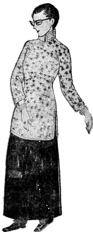
图1—6 民国初年妇女盛行的“文明新装”