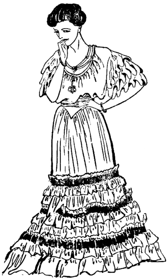
图1—11 1914年前流行的“青年派时装”