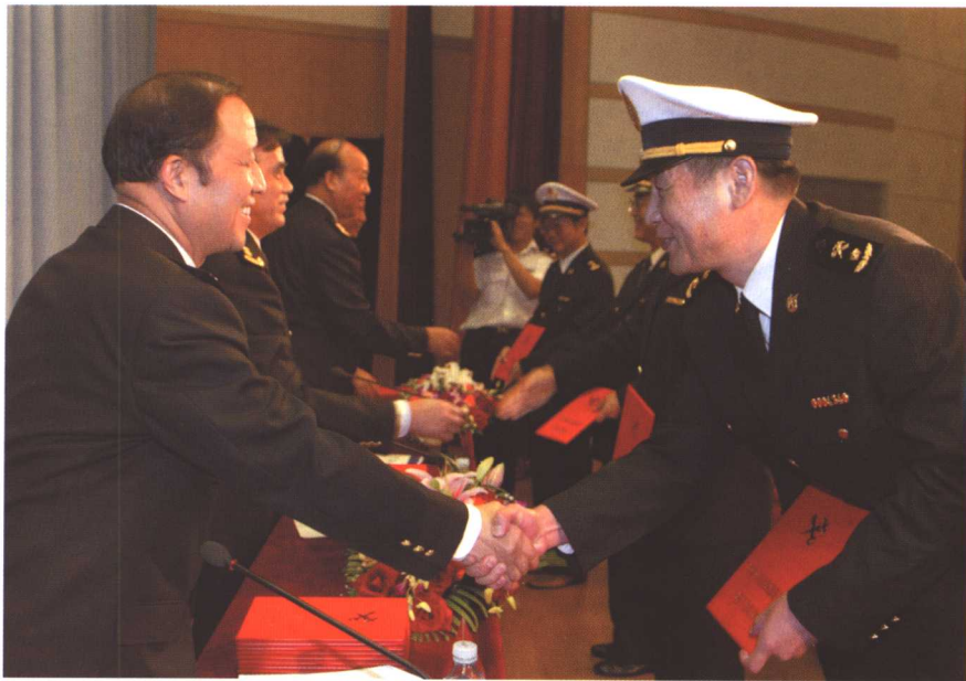
左上 2003年，中国海关正式实行关衔制度。9月15日，国家海关总署机关首次授予海关关衔仪式在北京海关举行，共有327名关员接受此次授衔。这是牟新生署长为授予三级关务监督人员及其他关衔人员代表颁发授衔命令证书。