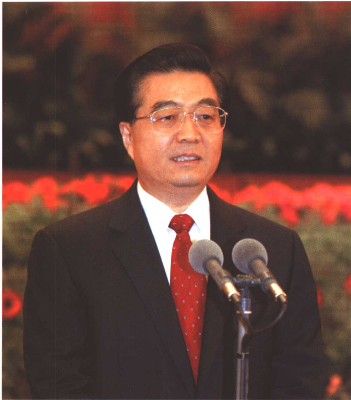
上 2004年1月20日，中共中央、国务院在北京人民大会堂举行2004年春节团拜会，党和国家领导人同首都各界人士4500多人欢聚一堂，辞旧迎新，共庆中国人民的传统节日。这是中共中央总书记、国家主席胡锦涛主持团拜会。