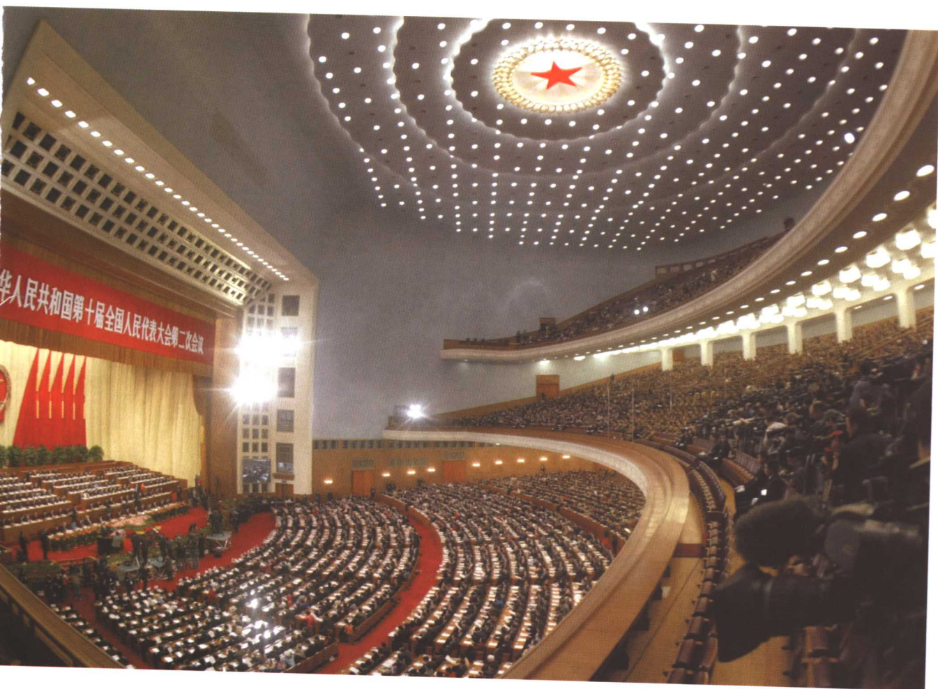
2004年3月5日上午9时，第十届全国人民代表大会第二次会议在北京人民大会堂开幕。这是大会会场。