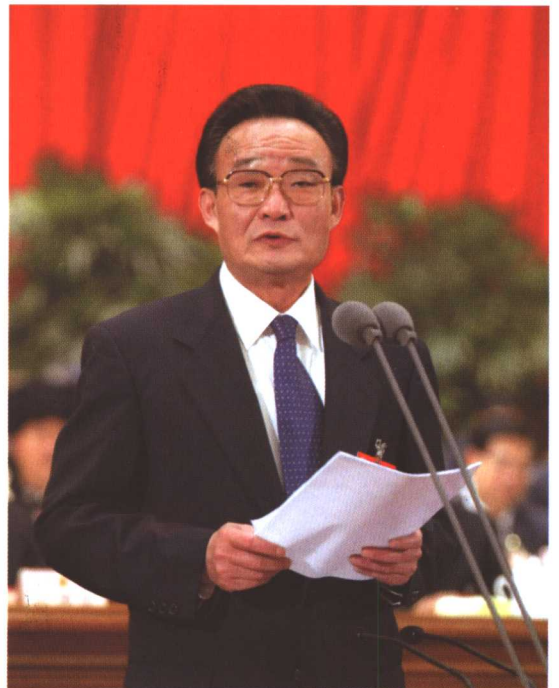
右下 2004年3月14日下午，十届全国人大二次会议在北京人民大会堂举行闭幕会。这是全国人大常委会委员长吴邦国主持会议。