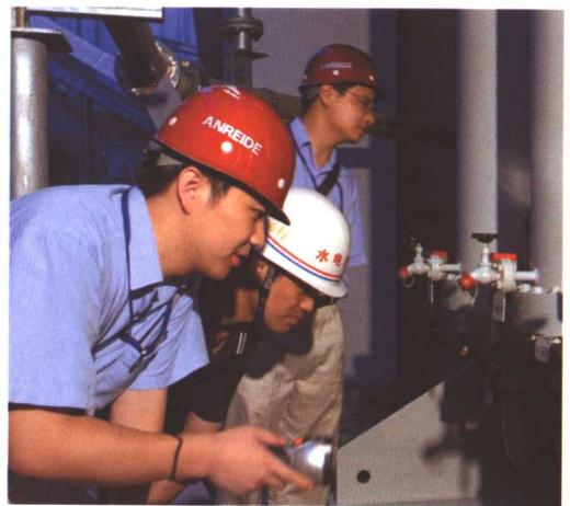
左中 2003年6月12日9时10分，我国首座商用重水堆核电站——秦山三期核电站二号机组在浙江海盐成功并网发电，比计划进度提前了91天。这是当日环境监测人员正悉心测试二号机组并网发电后的环境参数。