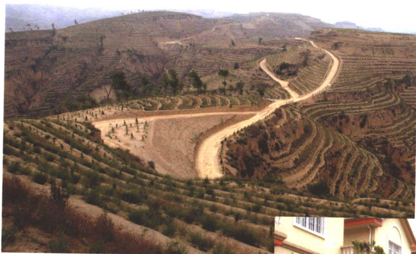
左上 地处黄河岸边的山西柳林县孟门镇 2003 年开始实施退耕还林工程，截至 6 月初已经完成全年 1.2 万亩的退耕还林任务。这是 2003 年 6 月 27 日拍摄的该镇罗家坡退耕还林工程区。