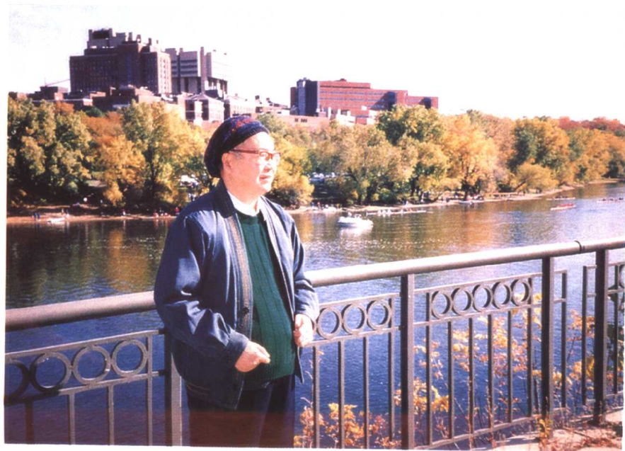
1993年摄于美国明尼苏达大学老人河