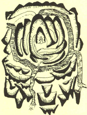
理想风水的景观模式