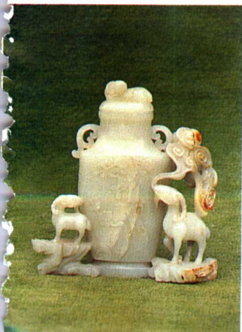
图9 青玉三羊开泰瓶