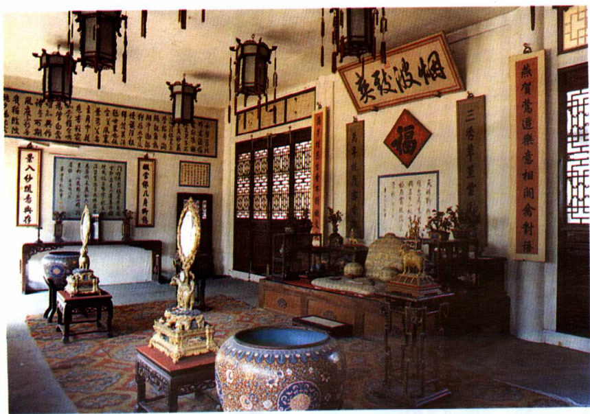
图4 承德避暑山庄烟波致爽殿内的吉祥物