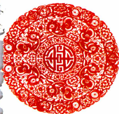
图7 内蒙古民间剪纸“六猴献寿”