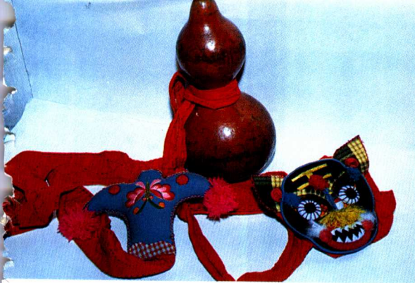
图5 虎头祥子 (鲍家虎供稿)