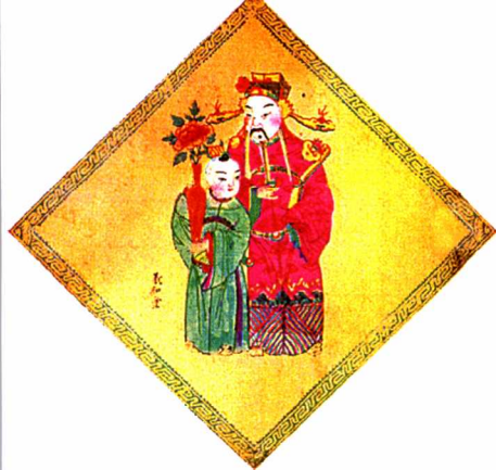
图11 和气吉祥