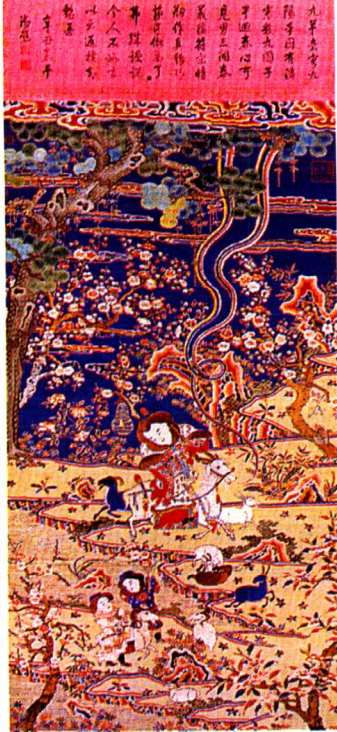
图2 河北蔚县剪纸 “喜报早春”