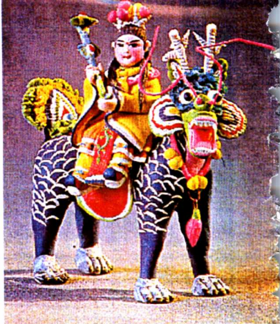
图12 麒麟送子