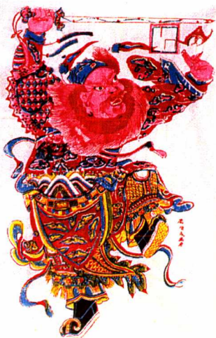
图6 钟馗 (鲍家虎供稿)