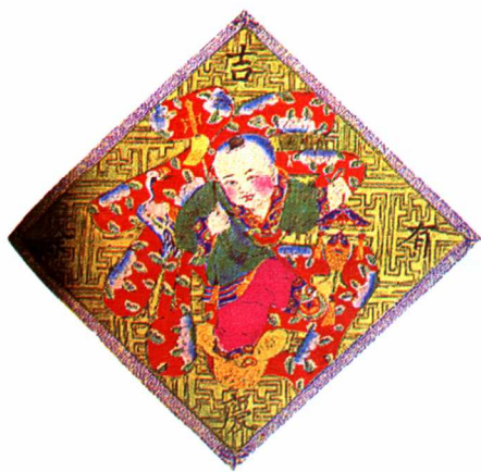
图8 吉庆有余