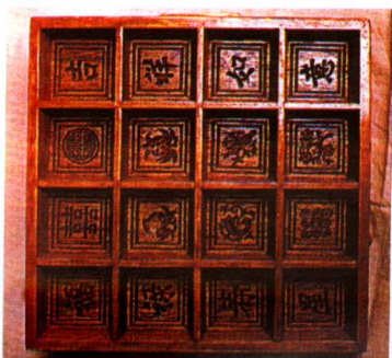
图10 江苏高邮吉祥图案案印 糕模 (鲍家虎供稿)