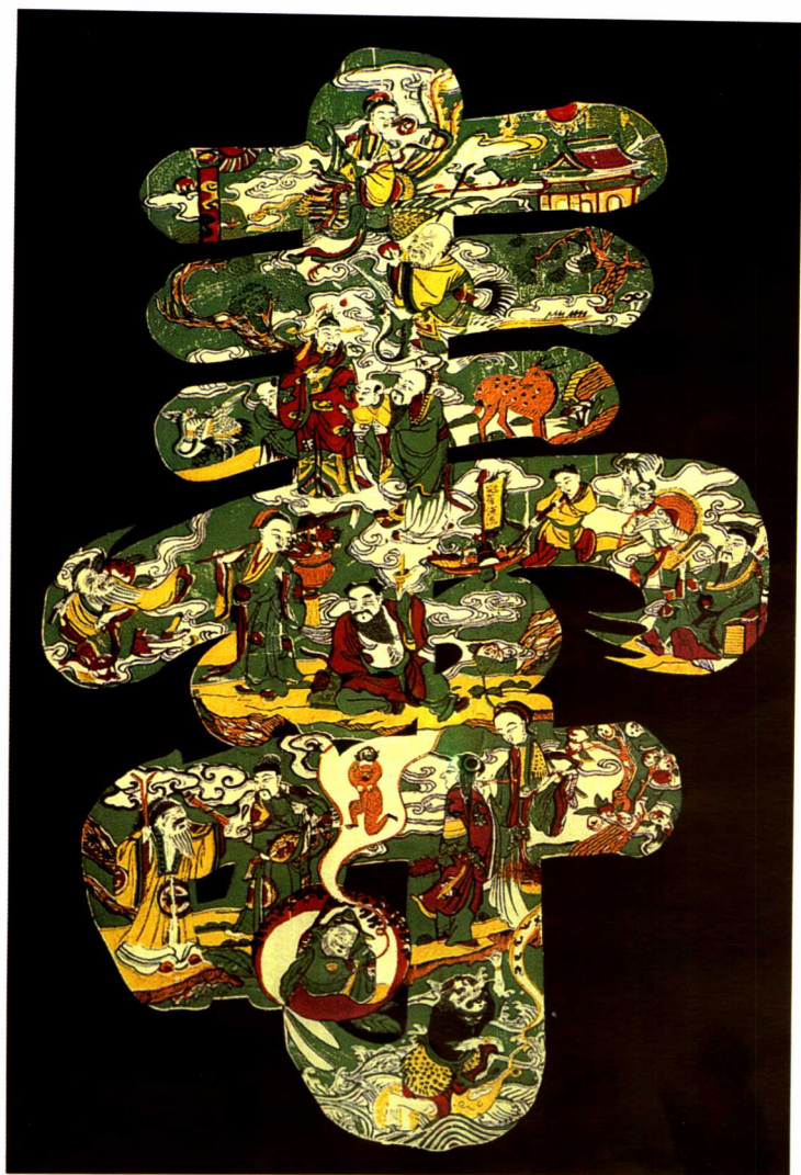
图1 江苏桃花坞年画“寿字图”。