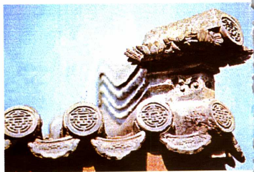
图14 北京西城区某宅屋脊蹲兽