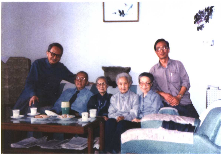
◎顾毓琇夫妇拜访梅贻琦夫人（一九九二年）