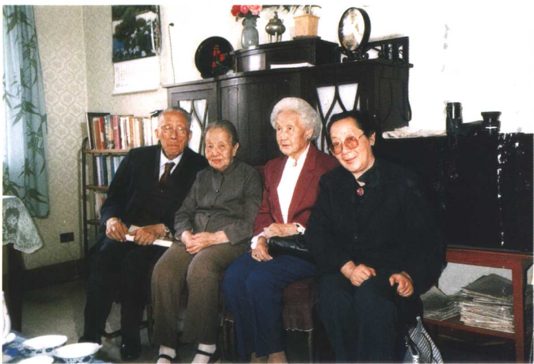
◎顾毓琇夫妇看望冰心先生（一九八九年）