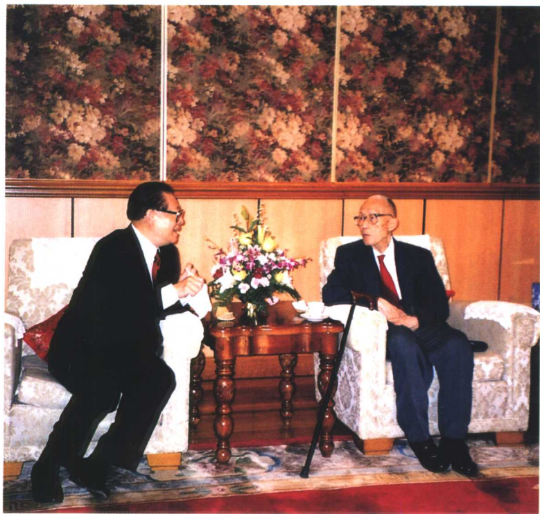
◎江泽民主席会见顾毓琇先生(二〇〇〇年九月九日)