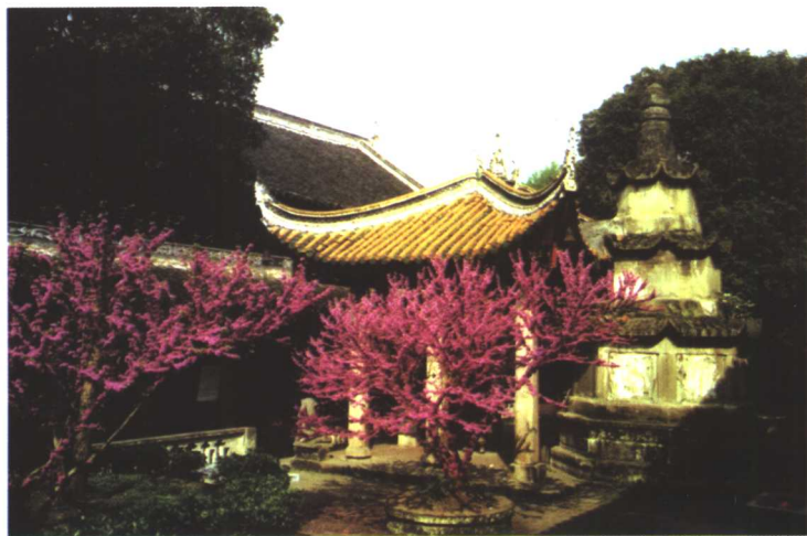
花木掩映中的破山禪師塔