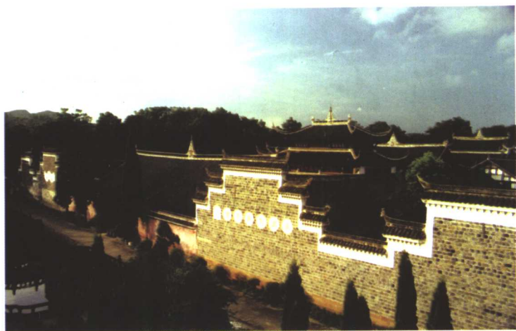
破山禪師道場——雙桂禪院