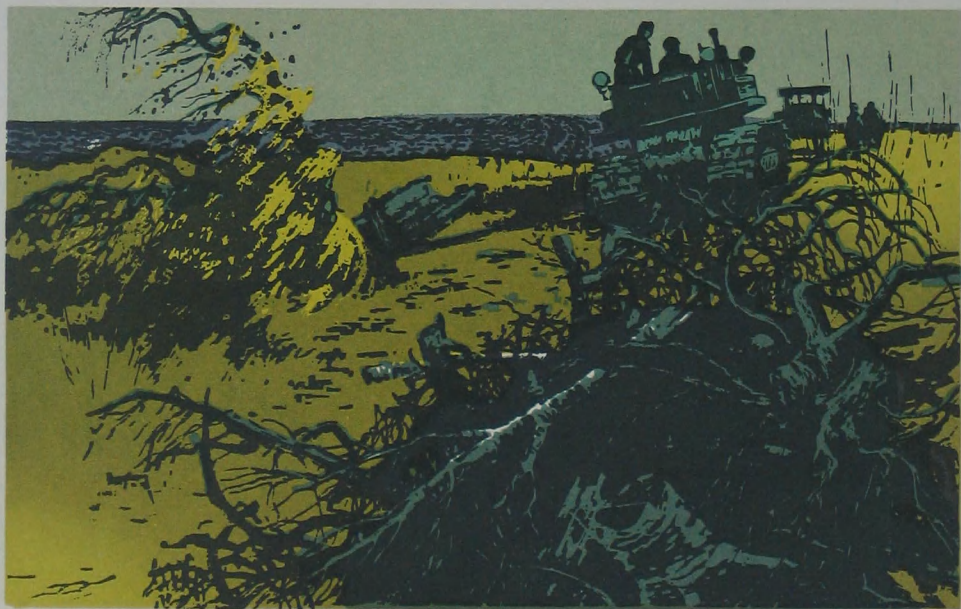
6. 排 障