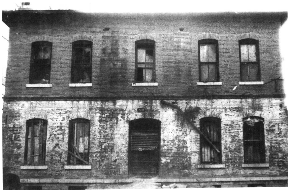
邢台北方大学旧址