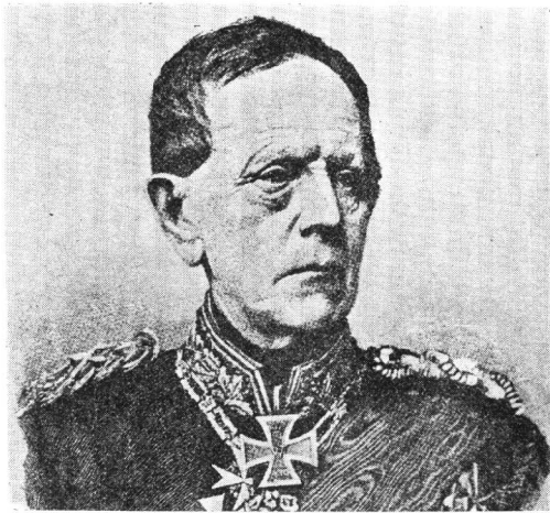
毛 奇 (Moltke)