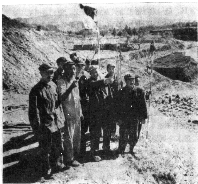
图为“三结合”技术小组，深入现场，进行勘察设计