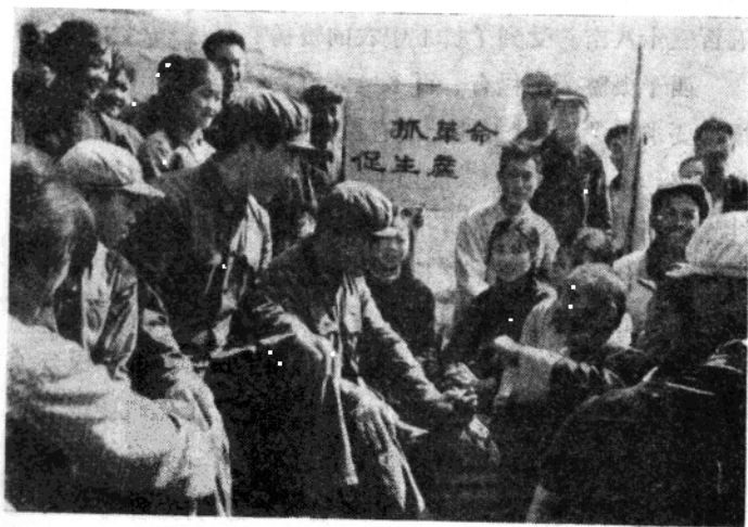
图为军代表在休息时，同干部、群众一起畅谈无产阶级文化大革命的大好形势，决心加快水库灌区的建设步伐，为人类做出较大贡献

由于建立了这样的政治工作制度，使工地上出现了一片生动活泼的政治局面，干部、群众的阶级斗争、路线斗争觉悟大大提高，为革命治水的思想更加坚定。同时，工地上涌现出许多象“钢铁连”、“铁姑娘”、“新愚公”、“土技术员”