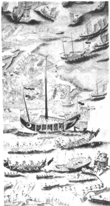
永樂年間琉球朝貢貿易船隊

永樂大典卷之一千五十六 二支 城池 羅泌路史神農氏國主相壁荒狗之聲相聞以大用小由中下外猶運指建瓴而王者以室以家為乃謀工定地為之城池以守之宋會要東京雜錄乾德三年四月募諸軍子弟導五夫河水通皇為池岳州志大城池在州北六十里 修復城池記皇朝初知巴陵守守和泰公事兼教首民共築土庫仲微事州西控蕪南閩湘潭東控鄂鄂三國時馬重鎮魯肅嘗以兵已其城因山為基北陵州治縣格東南獨西恃江為固三隅之外因路為壕險若天遠舊圖經謂悉經始於魯公之手侯景之亂王僧辨守巴陵以玩之景兵百道攻城力疲而敗乃知前賢所規度係險狹要至今賴之以安國朝葉因湖寇震擾見十指揮於內列九砦於外水平日久十指揮廢其六城壁亦就墮壞而外之禮池又為有刀者泄而墜之入薄少於公黎昔之所恃以爲險者皆蕩然不