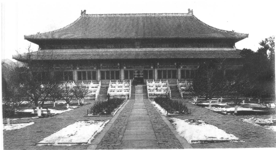
十三陵长陵棱恩殿