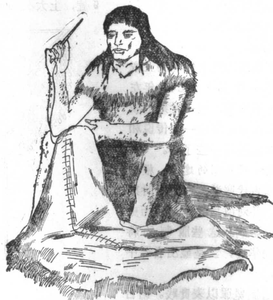
图2 古人用骨针缝兽皮做衣服