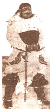
桃园三结义的张 飞