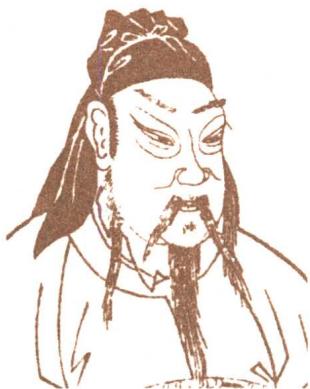
千里走单骑,被 洪门供奉的关羽

振兴汉祚。(岁次甲子)一百八十四年。那时是汉灵帝中平元年,张角以妖术惑众,聚愚民几十万起事,(因为这些人裹着黄巾,所以历史上叫他做黄巾贼。)勇不可当。刘、关、张三弟兄同心协力大破黄巾,这样一来,国家也便渐渐地认识了他们弟兄三个了。