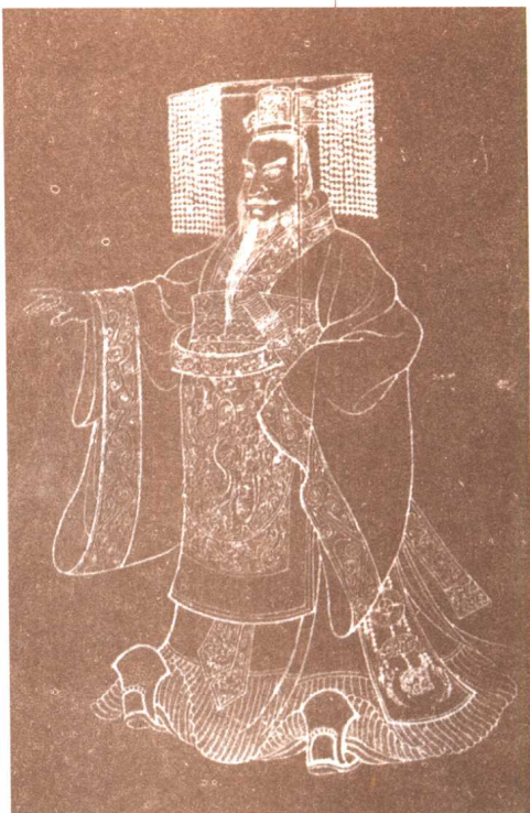
被荆珂刺杀未中的秦始皇