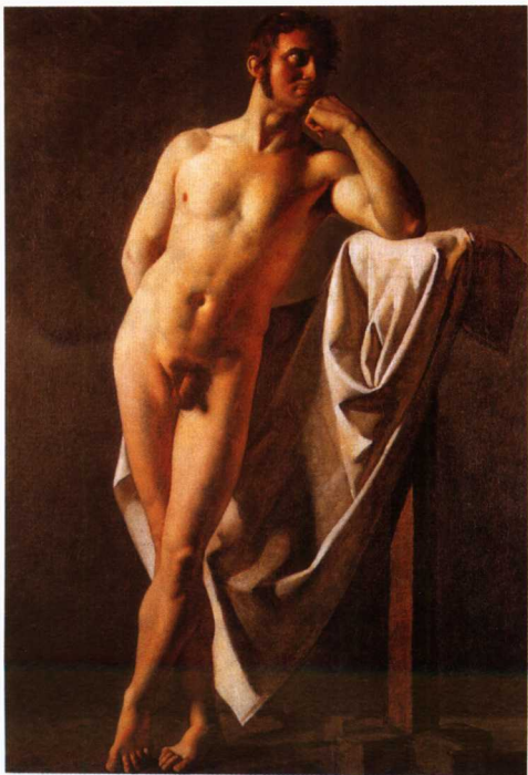
布上油画 79 × 56cm 蒙托邦安格尔博物馆藏

这幅画是安格尔的课堂习作，描绘的是一位长鬃角的裸体男子。画面上，男子左手支肘托腮倚在搭着背景布的高台上。背景中的幕布如同模特儿穿的衣服，缓和了从肌肤到高台的过渡。细颈的高台似乎无法将重量一直承受住，但底下十字形的台座使重心有了支撑，这是古典主义一向要求强调的平衡。