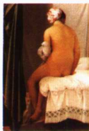
第一影响力艺术宝库

那种流畅和“灵魂”，如创作于1819年的《保罗与弗朗切斯卡》。当他模仿提香时，那简直就是拉斐尔，这时的作品就成为珍贵的杰作。当他初访罗马之后，他又完善了自己的绘画风格，他的艺术也到达了鼎盛期。