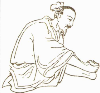
左页图：孔子观乡人射箭图。

右页图：八段锦为传统的养生功法，其名称最早见于北宋洪迈的《夷坚志》。后经历代发展，到晚清时定为以下八段时法：“两手托天理三焦，左右开弓似射雕，调理脾胃须单举，五劳七伤向后瞧，摇头摆尾去心火，背后七颠百病消，攒拳怒目增气力，两手攀足固肾腰”。