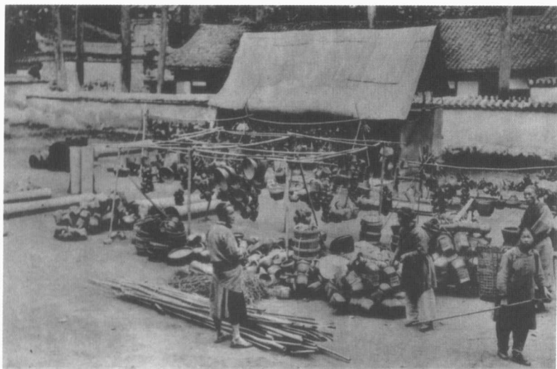
成都青羊宫外的农村集市，卖竹篾、竹笋、竹箕等竹器。一个农夫背负一捆竹子来卖。一个农妇背着背篋（内盛已买物品）离去。她拿一根竿，回家路上打狗用。

太平街走完，进入玉石街。玉石街很短，街上有三家玉石加工作坊，技师正在车磨玉圈，值得一看。他坐在木制的车床上，双脚交替踩踏，绳索带动套着玉圈的轴来回自转，使玉圈与他手掌中紧握的金刚砂互相磨擦，终致打磨光滑，显现出莹润来。这样加工玉器，在成都地区已有三千四百年的历史了。不信去看看2001年成都西郊金沙村出土的大批玉器吧。其中就有玉圈，还有玉璧，正是这样加工而成的。如果去三星堆博物馆看看，你更要吃惊，那里的出土玉琮暗示三千八百年前已有异常精美的玉器制作了。