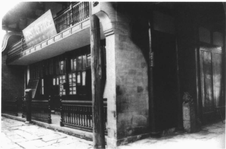
拍摄于1920年的成都一家商店门面。

巧精致，放在桌上使用。箱盖内嵌玻璃镜子，推盖立起，便可照容。箱中分层分格，放置扑粉、桃儿粉、胭脂、挑发针、生发油、梳子、篦子、刷子、镊子、绞线、丝缠、耳环、簪子以及各种首饰杂件，以备闺阁晨妆之需。这类细木工小作坊，坊主就是师傅，带徒弟一两名，内间制作，外间销售，忙得生趣盎然。你或许会疑问，如此多的同业作坊，如此多的同类产品，挤在一条街上，生意岂不互相影响？放心好了。同业作坊丛聚一街早已如此，实有便于外州外县客商前来采购。设若星散开了，成都这么大，到哪去找呢？太平街的灵牌和镜匣是这样，锣锅巷的木器家具，东御街的铜器杂件，银丝街的银器，顺城街的白铜水烟袋，皮房街的皮革制