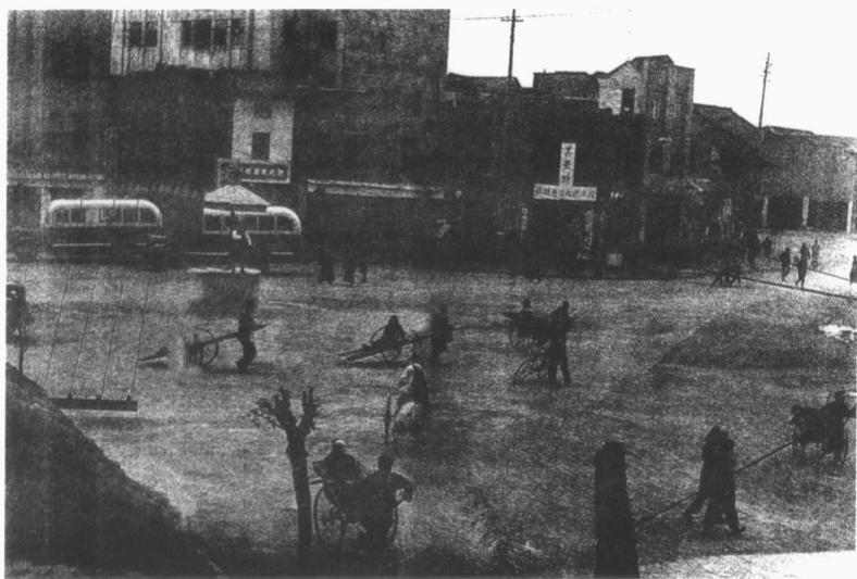
此为老成都的市中心。旧时盐工挑运块盐于商栈，由此销售，故名盐市口。