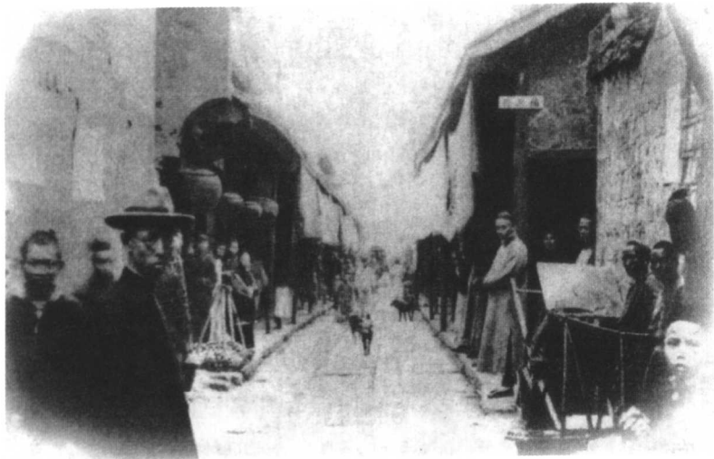
民国初年的福兴街，专卖帽子。

再向北行，到太平街北口，有一家香烟店。店内靠壁，设置一座阶梯木架，架上密排一盒盒的高档香烟，品相精美，灿然待售。门面上悬挂着一丛丛的彩色印刷纸条，迎风飘动。这就是那时的彩票了，由香烟店寄售。营业柜台黑漆晃亮，内坐店主，戴着眼镜，二十七岁，含笑招呼过路的熟人，有时抛去一盒香烟，算作敬奉。这位店主就是家父，四川法政学堂毕业，求职不果，改行经商。抛烟敬友之举，日日有之。母亲看见，不免怨言：“耍公爷一个，做啥生意嘛。”