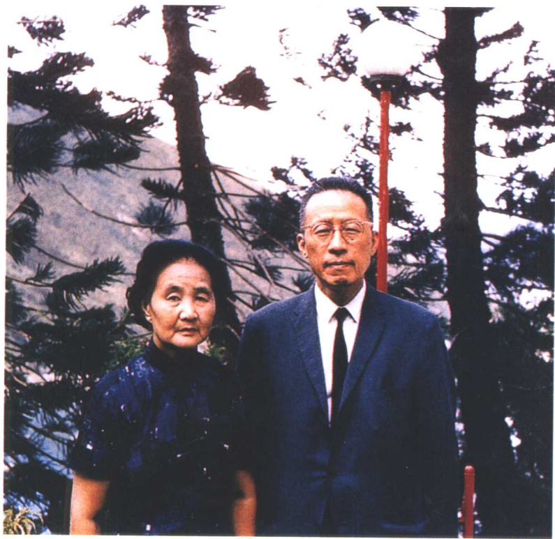
◎顾毓琇夫妇（一九七二年在美国）