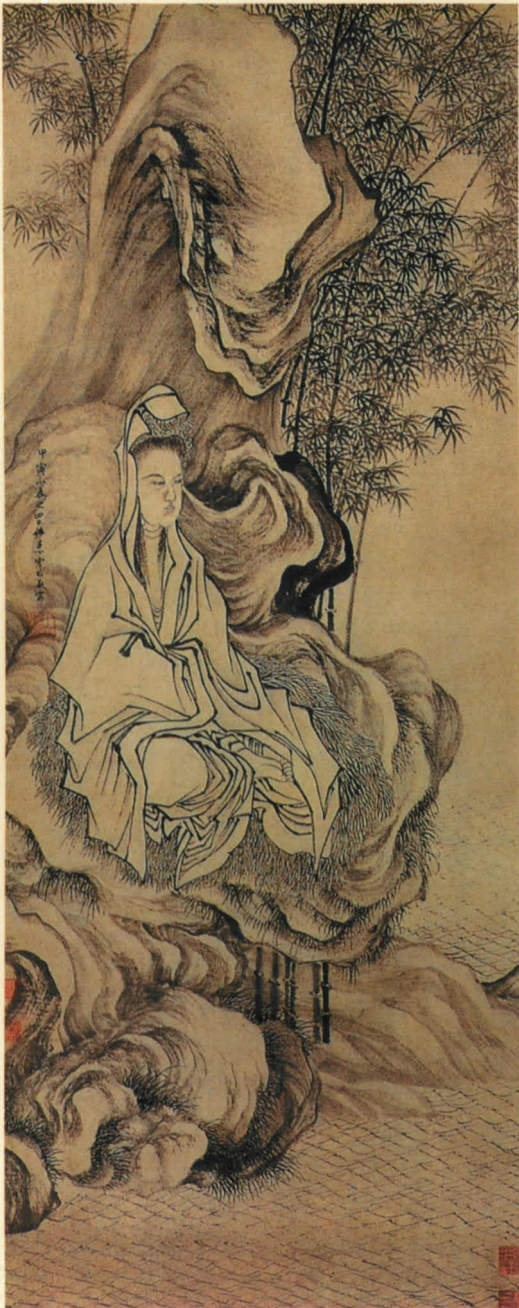
(明) 丁云鹏 观音大士