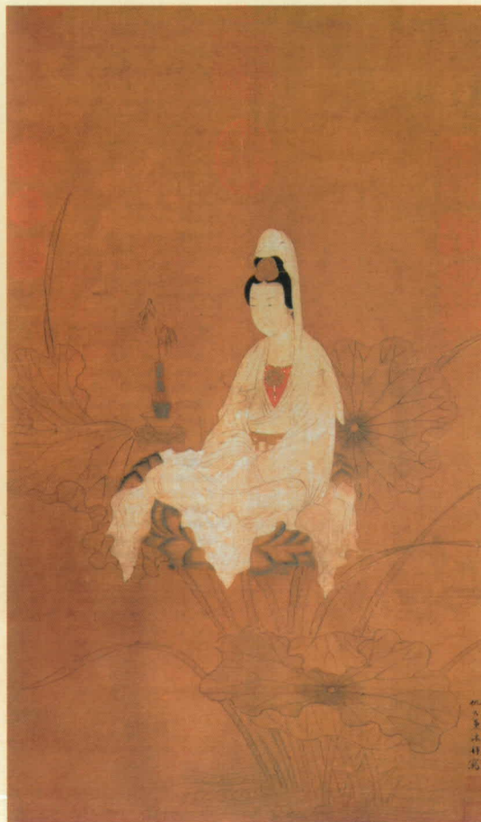
(明) 杜陵内史 白衣大士