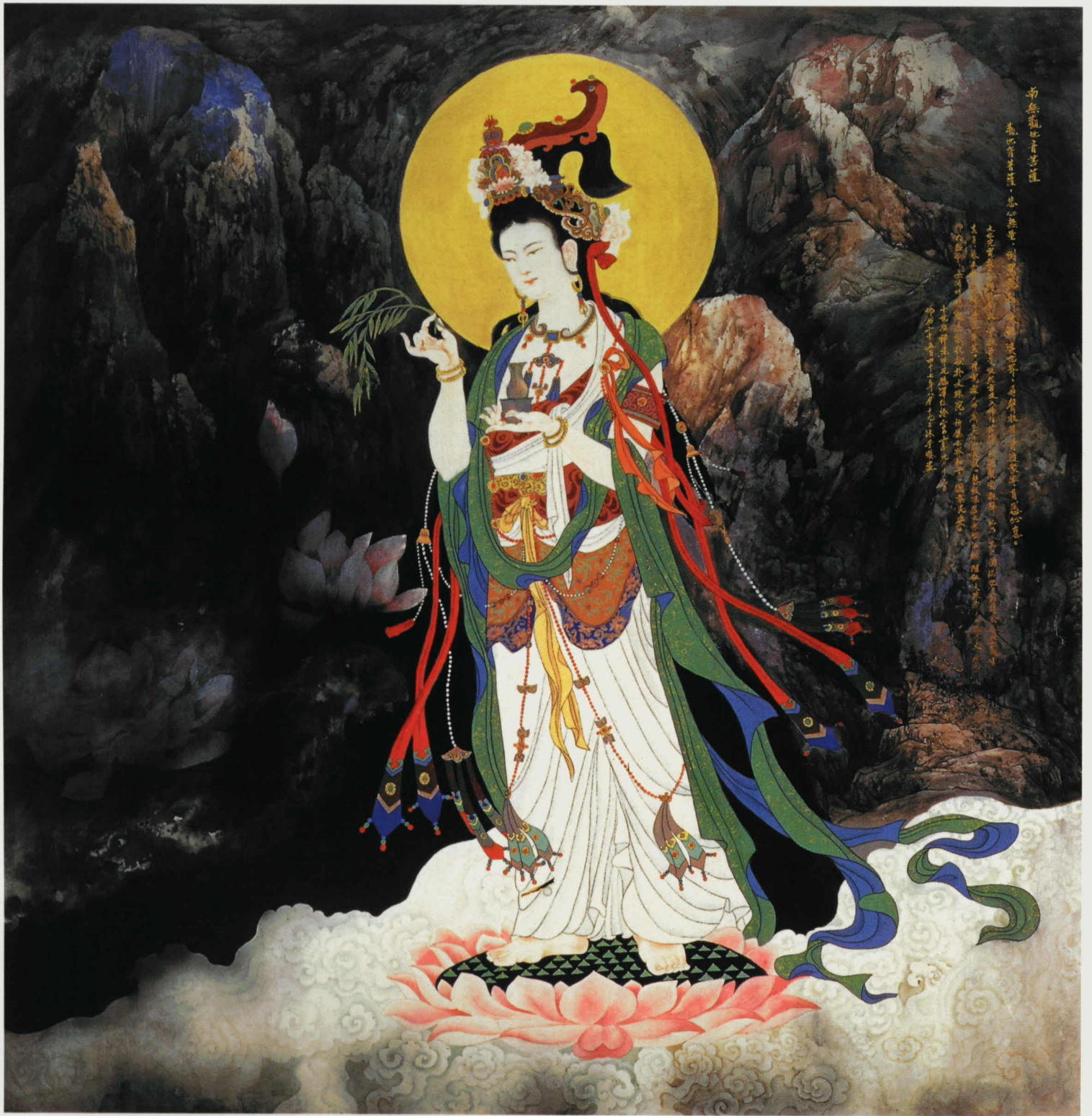
南无观世音菩萨 · 尼玛泽仁