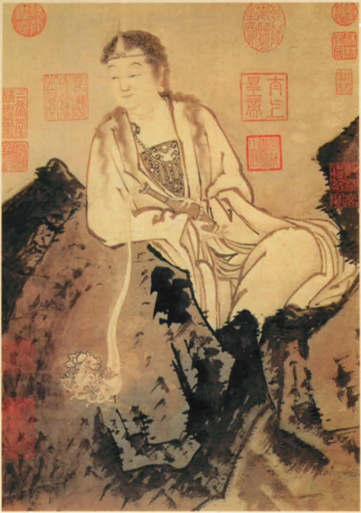
(宋) 贾师古 大士像