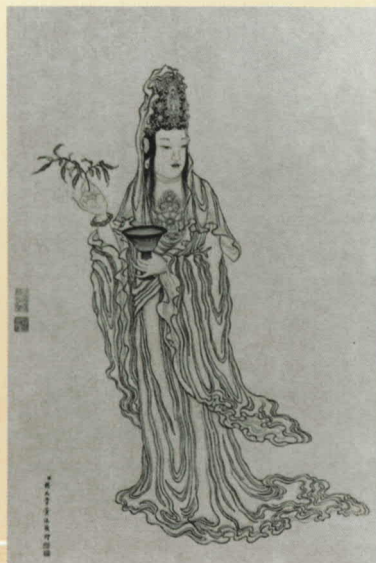
(清) 杨大章 甘露大士