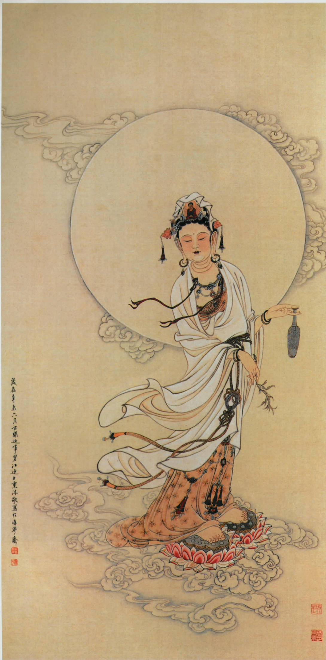
甘露安养 · 江逸子