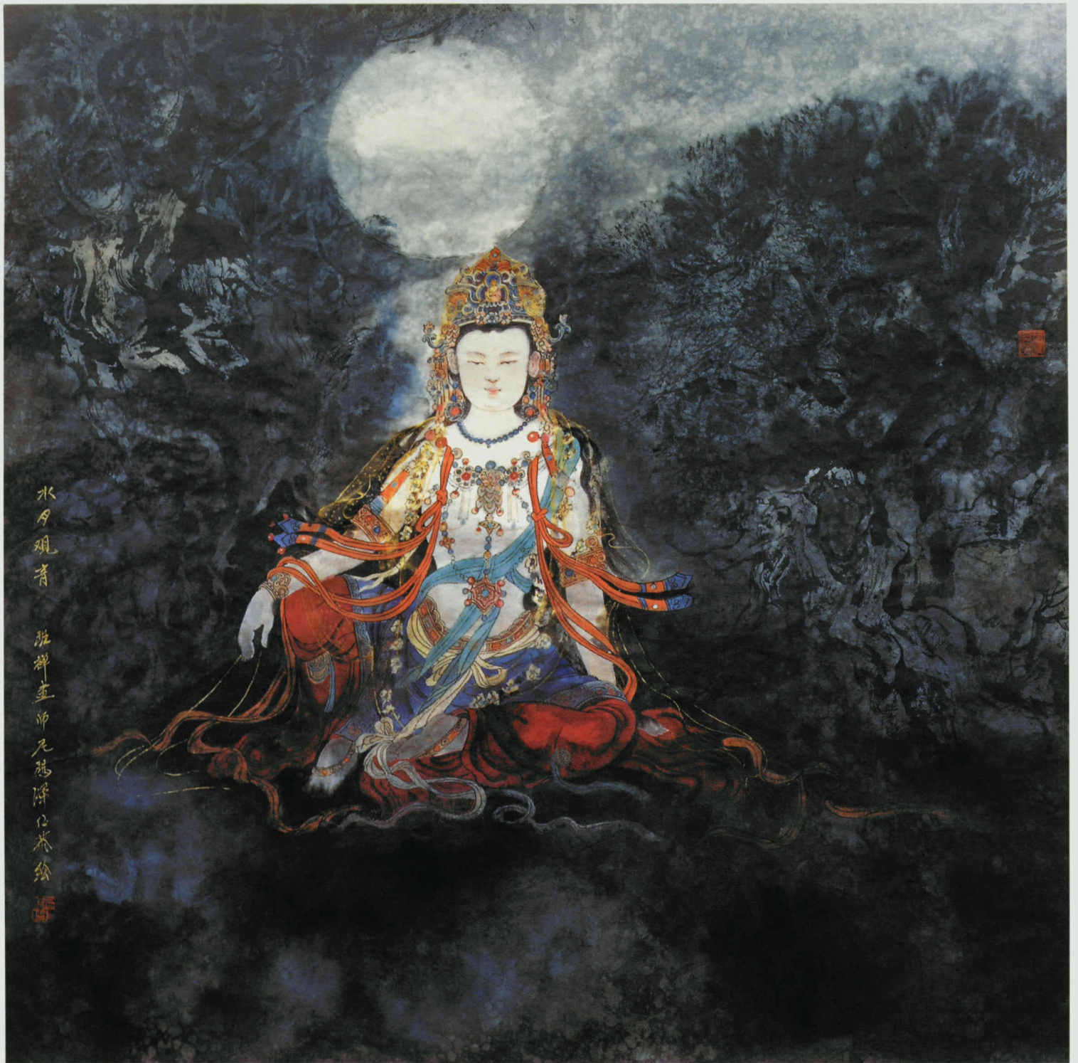
水月观音 · 尼玛泽仁