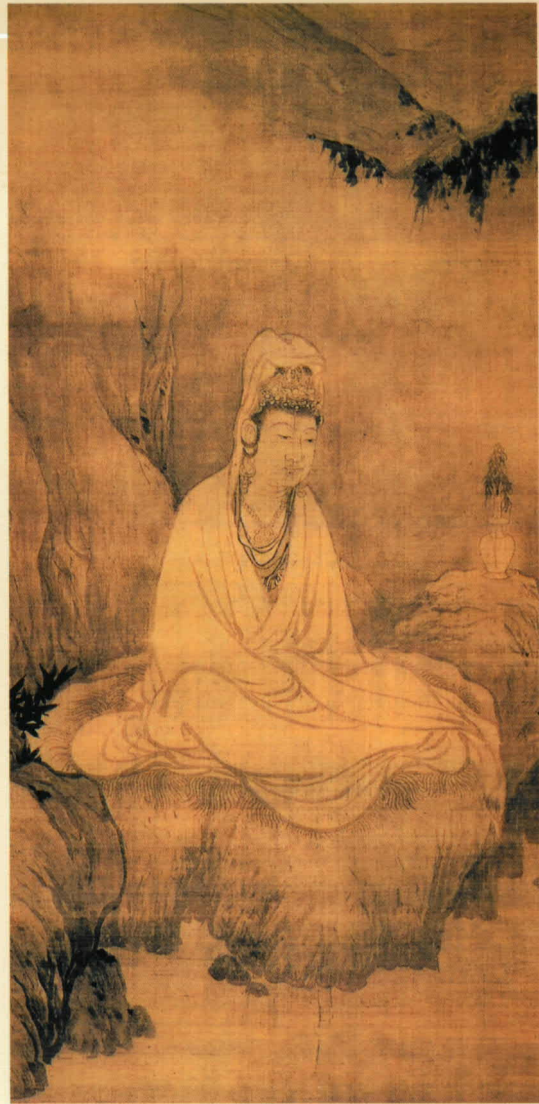
(宋) 牧溪 白衣观音图