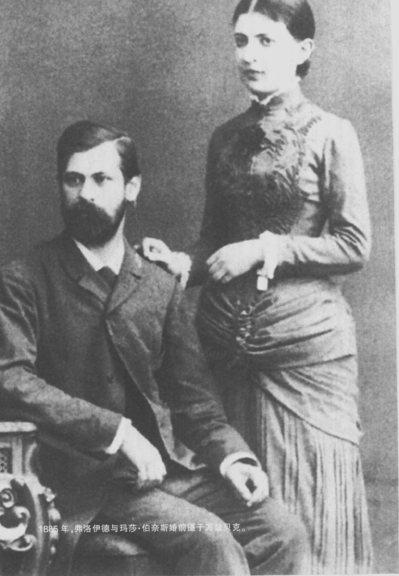
1885年，弗洛伊德与玛莎·伯奈斯婚前摄于万兹贝克。