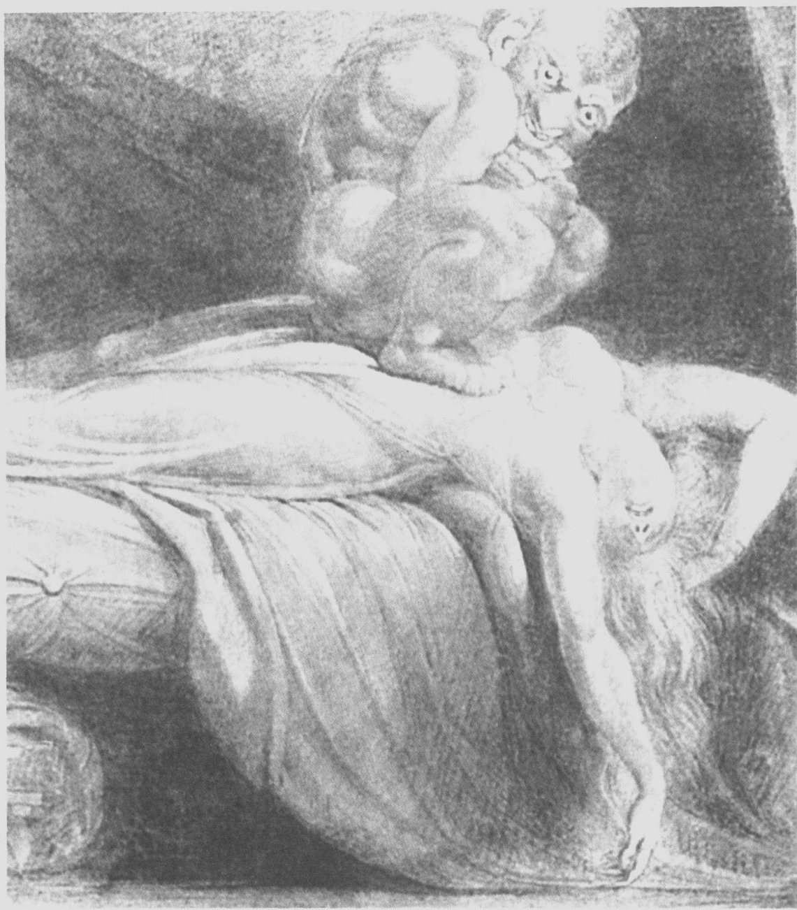
梦中景象 傅斯利 素描