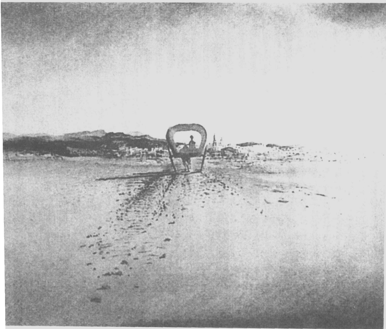
梦幻驿站 达利 画