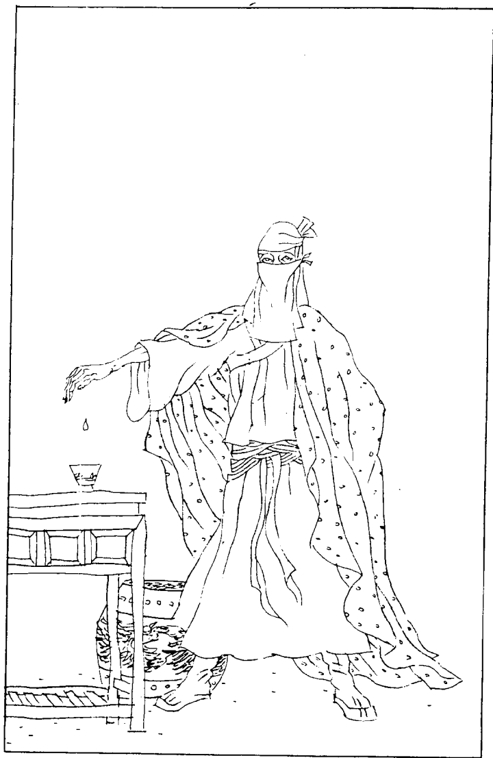
血口流血也慢，半天才滴得半杯。