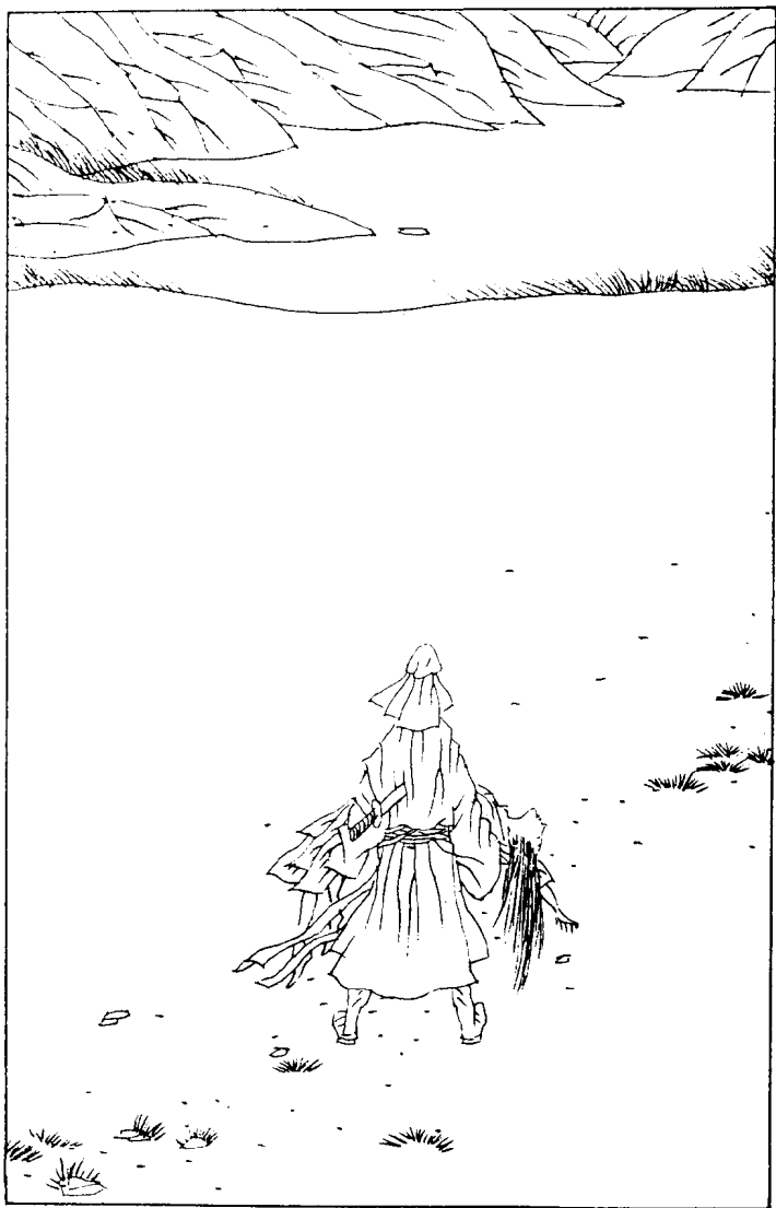
骷髅人抱起了阿妖，向天池走去。