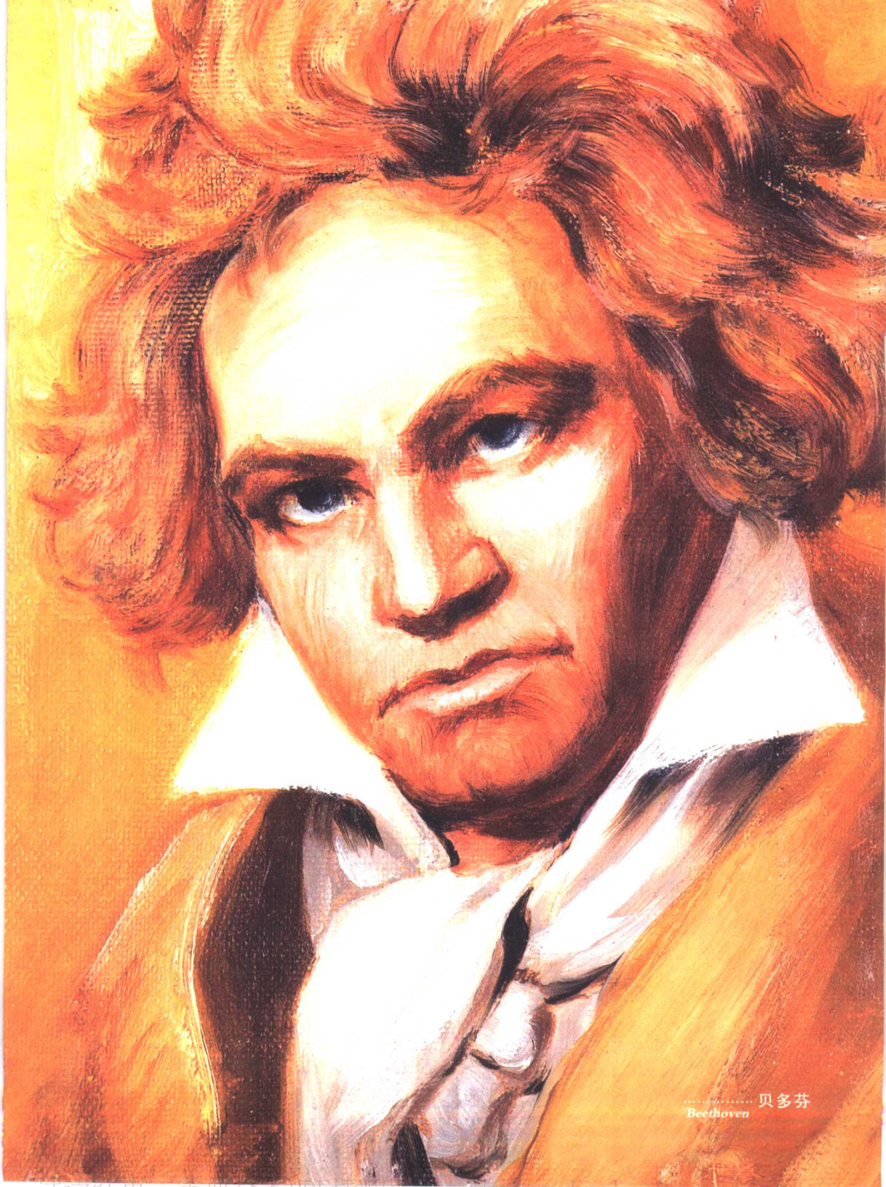
..... 贝多芬 Beethoven