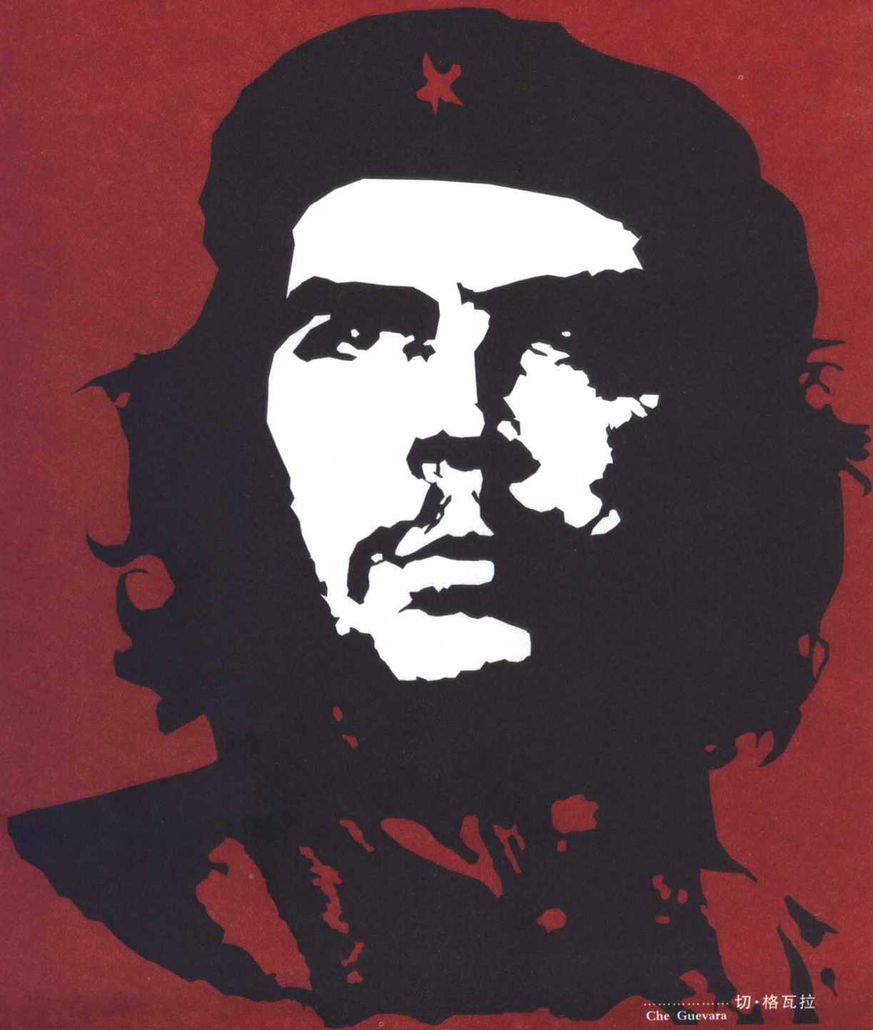
.....切·格瓦拉 Che Guevara