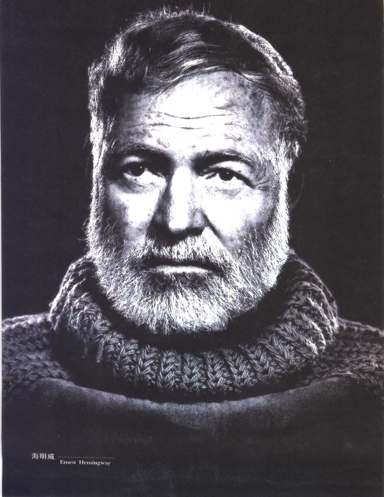
海明威 ..... Ernest Hemingway