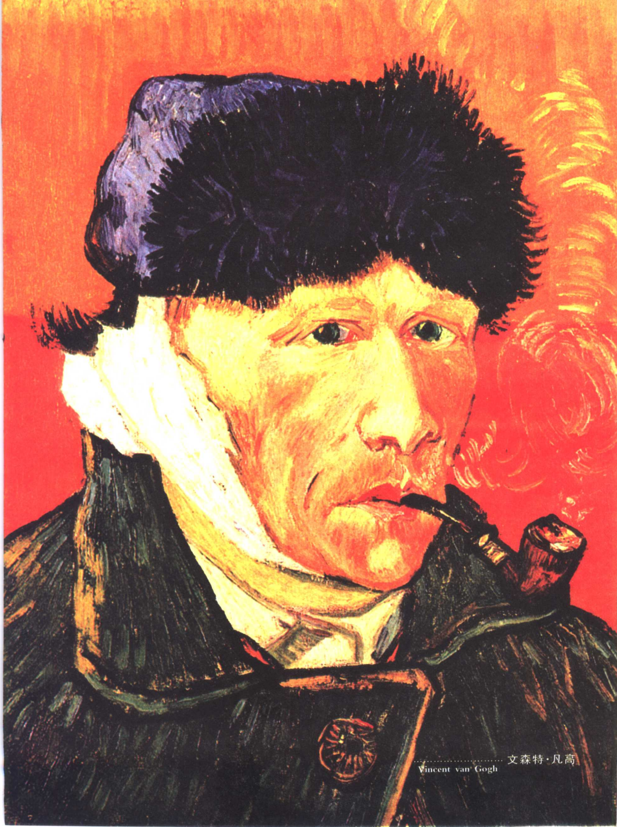
..... 文森特·凡高 Vincent van Gogh