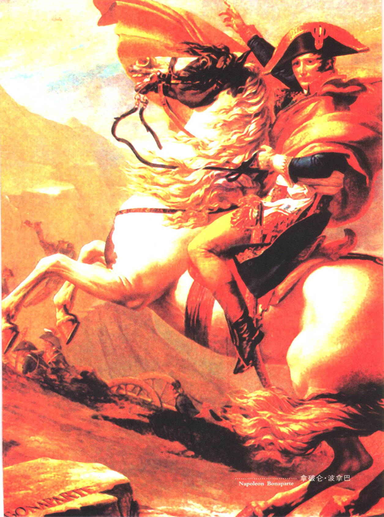
拿破仑·波拿巴 Napoleon Bonaparte