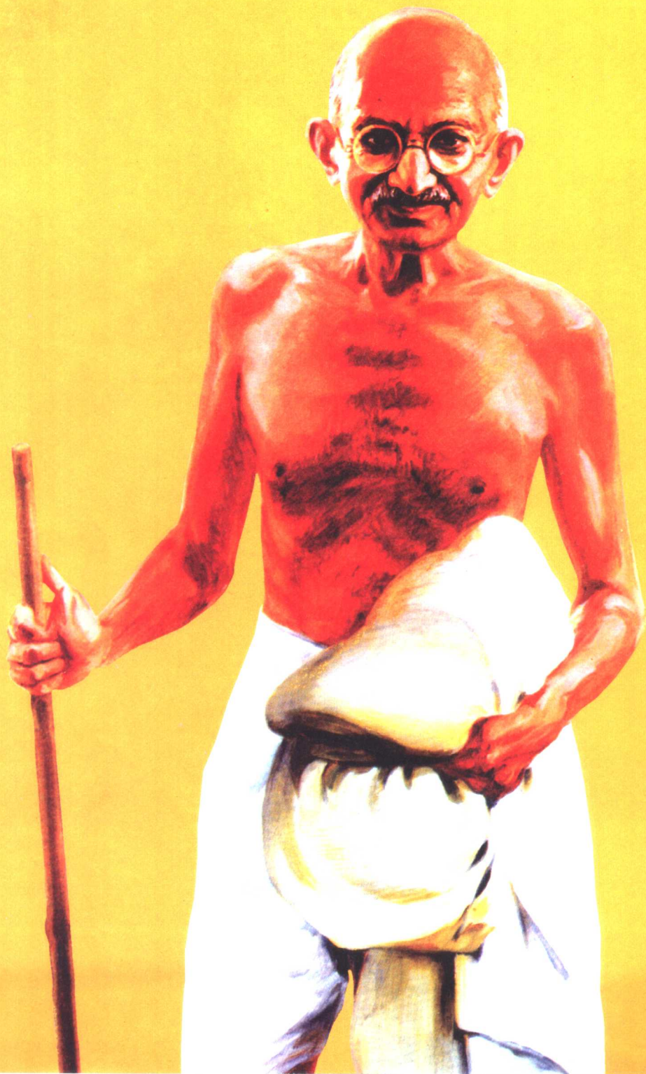
甘地 ..... Gandhi