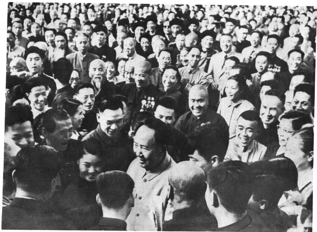
毛主席和人民代表在一起