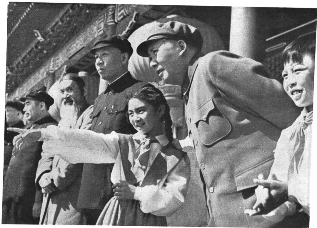
毛主席和少年兒童