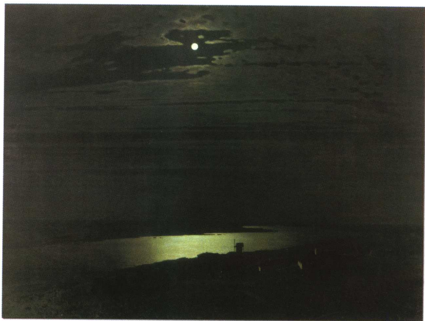
库因芝:《第聂伯河上的月夜》