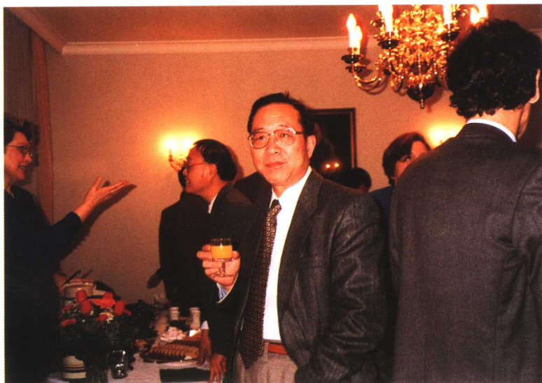
访问瑞士时在招待会上(1996年)