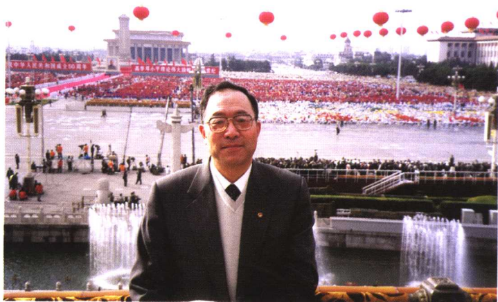
在天安门城楼上参加建国五十周年盛典