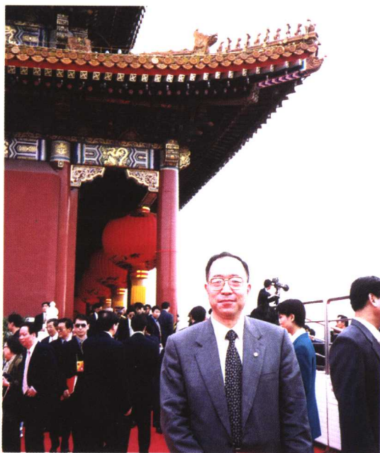
在天安门城楼上参加建国五十周年盛典