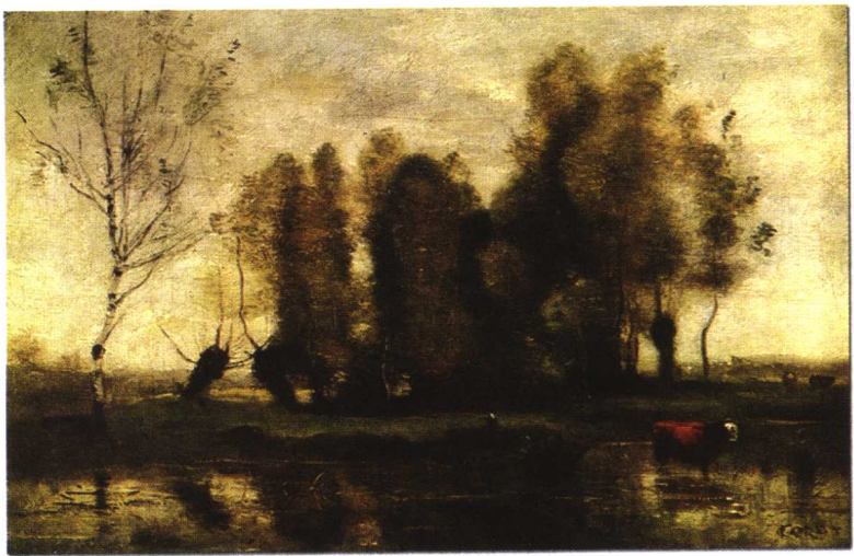
柯罗:《沼泽中的树林》