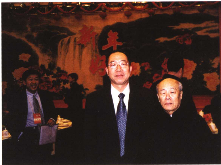
和书法家欧阳中石在新年茶话会上(2003年)