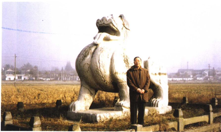
在南京郊外参观南朝陵墓石雕(2001年)