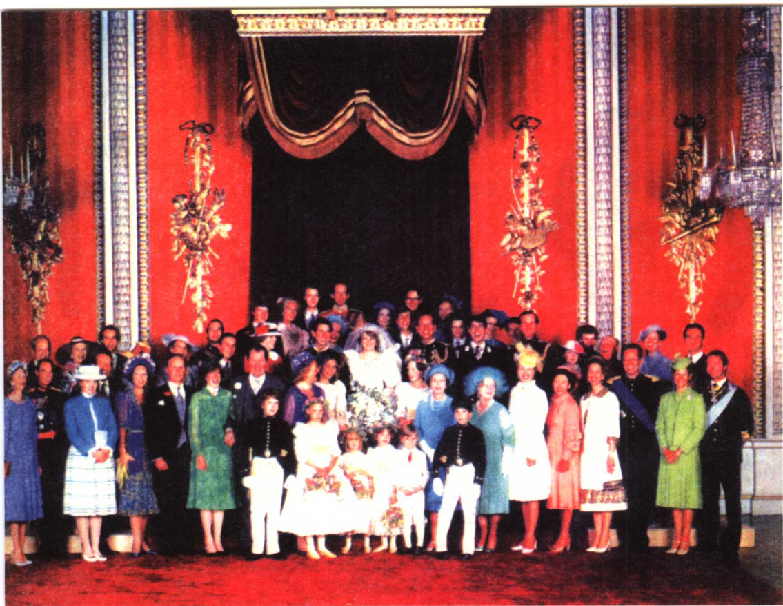
■ 婚礼后，王室家族的全家福

这些人有共同的特质：对女人能够态度卑下，把她宠得如同掌上明珠，随时等候她的召唤，细心体贴……，只不过，他们只能是地下情人，他们都是有妇之夫。与世界上最美丽最有名的女人偷情谁都愿意，但是公开娶威尔士王妃却永远不会提上日程。