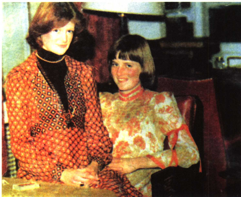
■ 少女时代的戴安娜与姐姐萨拉

句古语——自古红颜多薄命，不许人间见白头。英雄美人，都有如此悲凉处。红颜与薄命，美丽与哀愁，似乎总是联系在一起。