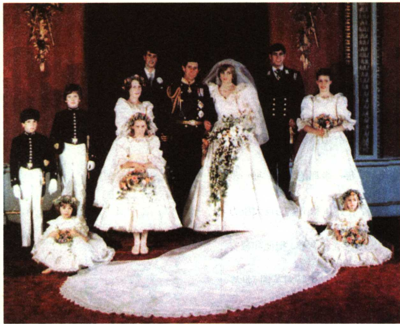
■ 1981年戴安娜与查尔斯的结婚照