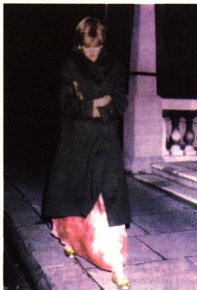
■ 17岁的戴安娜孤独走在回家的路上

她的美貌风采，使她天生就是公主。被王室选中，又成为媒体的亮点，赢得全世界的喝彩。但是美丽也使她站在了孤独的看台上，找不到自己的方向。