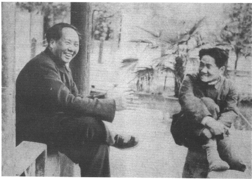
图为毛泽东同他的长子毛岸英在一起。

在毛岸英同龄的一代青年中，有他那样非凡经历的人是少见的。他 8 岁就随母亲坐过牢，还曾流落于上海，后来他去苏联进过军事学院和语言学院，在苏联卫国战争中当过坦克兵中尉，随苏军一直打到过德国。回国后他又从事过农、工、保卫和军事工作。他到志愿军总部的一个月里，和其他同志一样没日没夜的工作，没有享受过任何特殊照顾，也从没有向任何人透露过自己的出身。除极少数领导外，一般人都认为他只是一个年轻、活泼、朴实、能干的秘书兼俄语翻译。只是当彭德怀司令员默立在他安睡的薄木棺材前致哀时，大家才知道他就是毛主席的儿子。