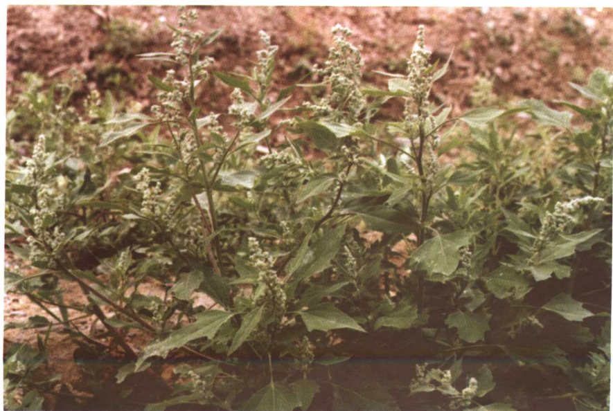
彩图 7 藜