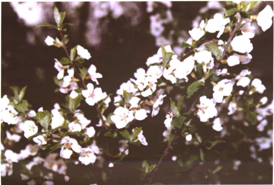
彩图 30 毛樱桃