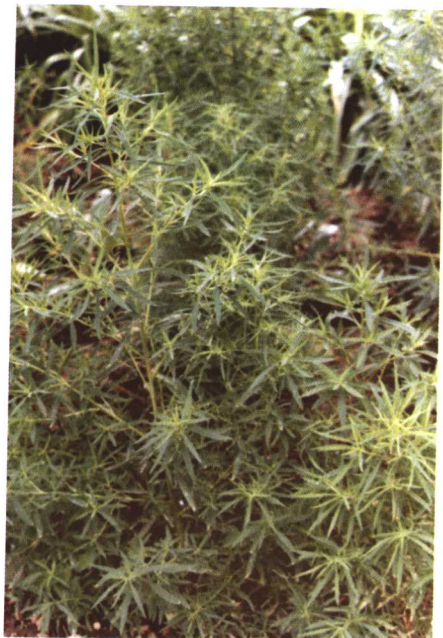
彩图 11 地肤