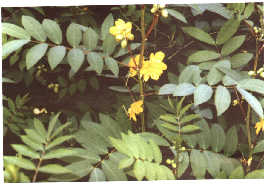
彩图5 苕芒决明