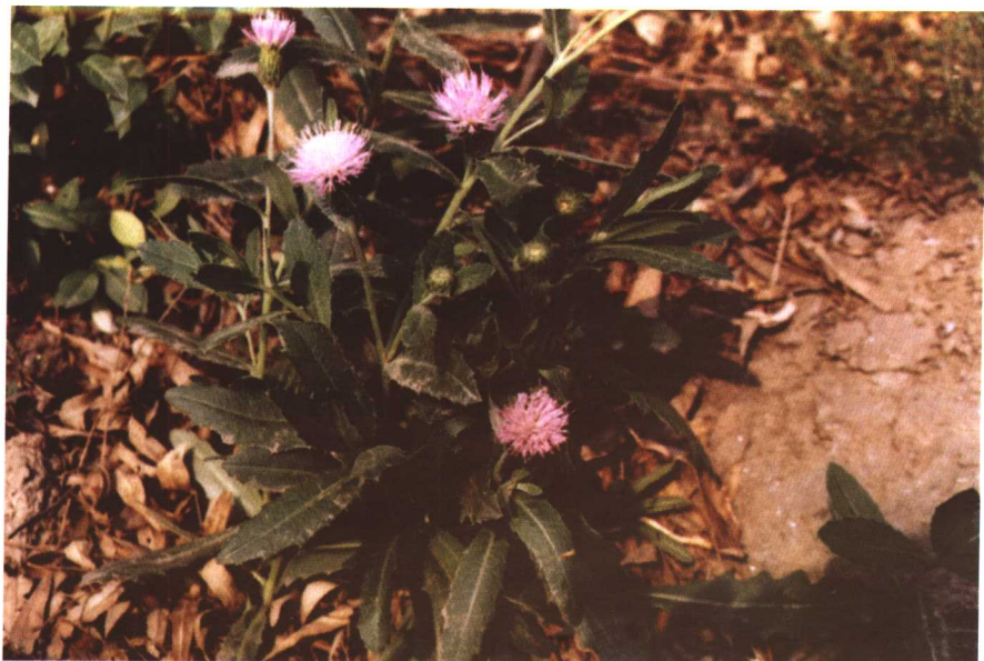
彩图 6 小薊