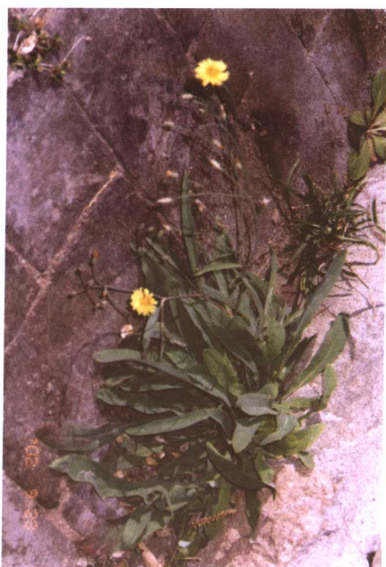
彩图 18 败酱草 (曹广才摄)