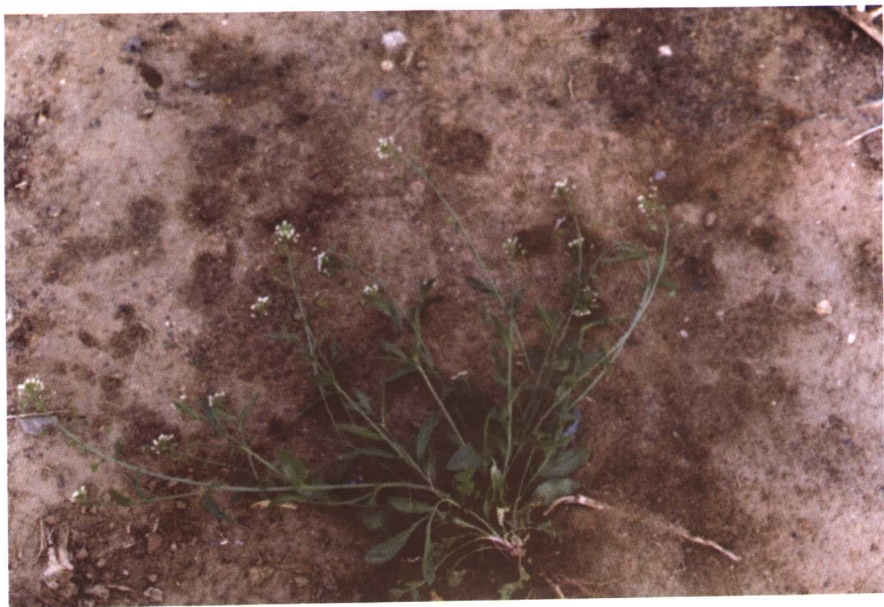
彩图4 荠菜