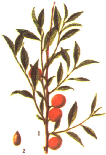
彩图 29 欧李 (引自《东北常用中草药手册》)