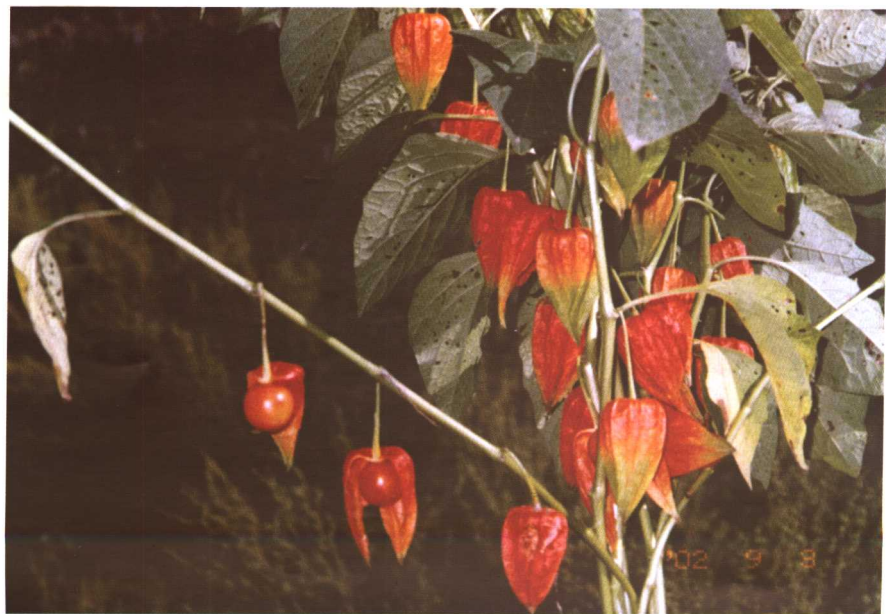
彩图 28 酸浆