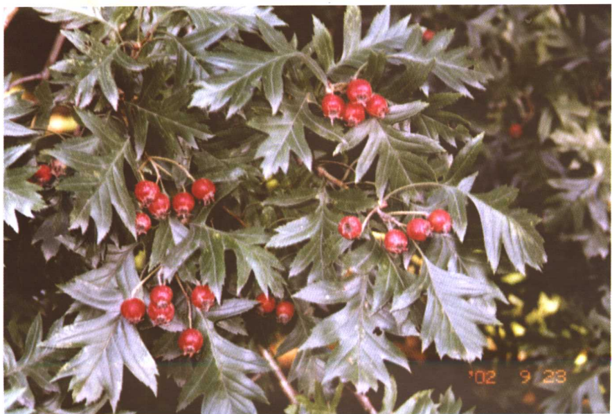
彩图 23 山楂