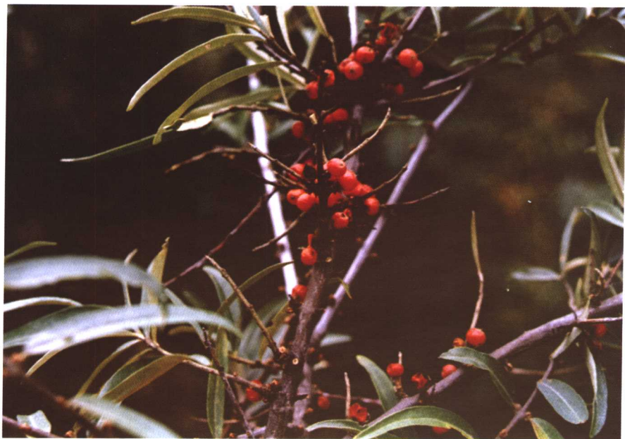
彩图 27 沙棘