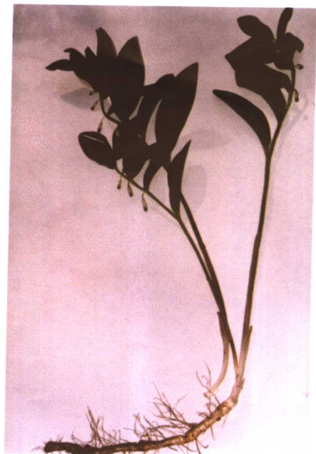
彩图 12 玉竹