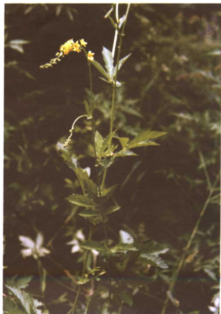
彩图 34 仙鹤草