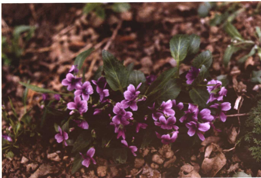
彩图 20 紫花地丁