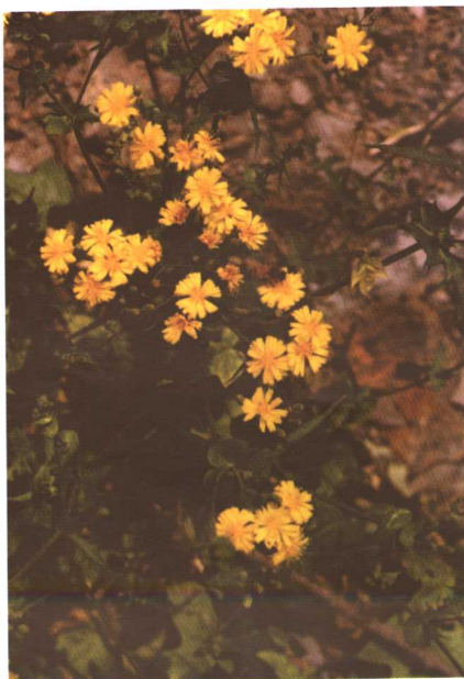
彩图10 苦蕒菜