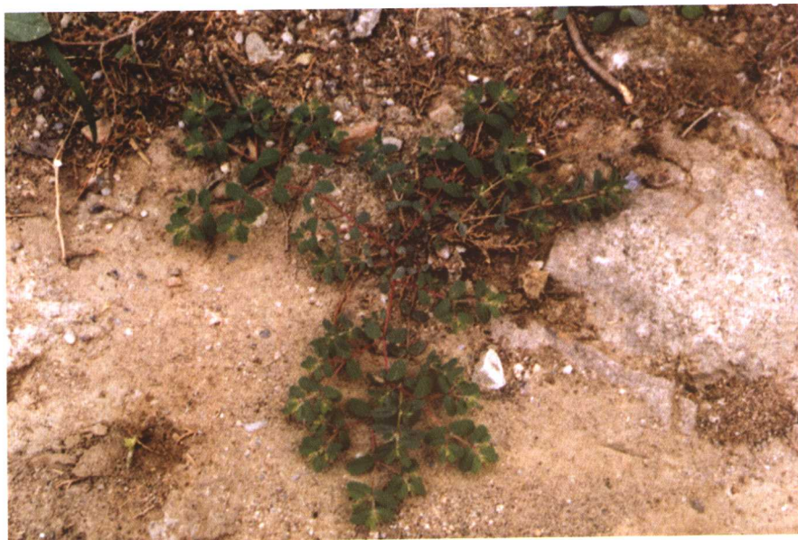
彩图8 地锦草 (曹广才摄)