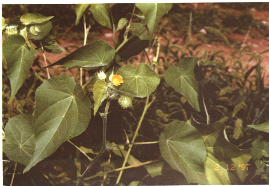
彩图 21 苘麻