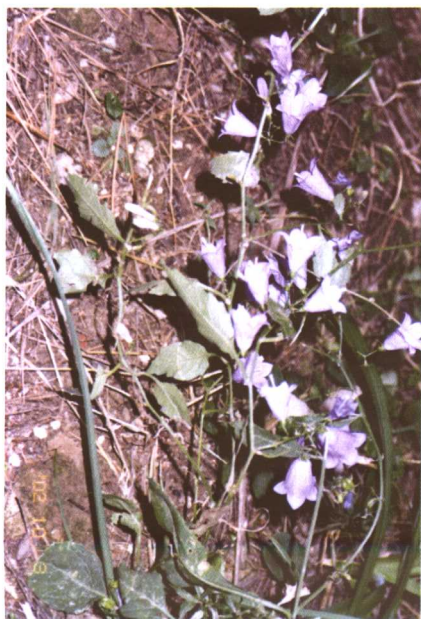
彩图 33 泡沙参