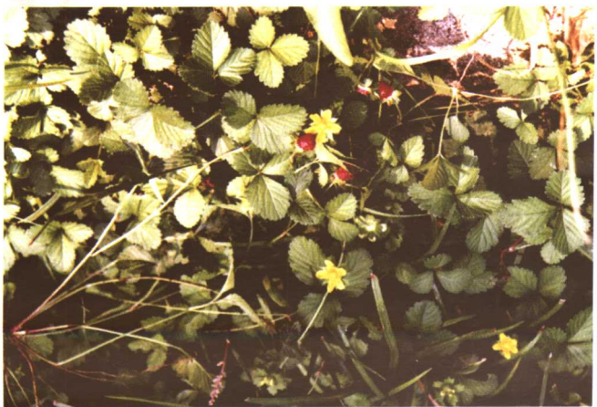
彩图 26 蛇莓