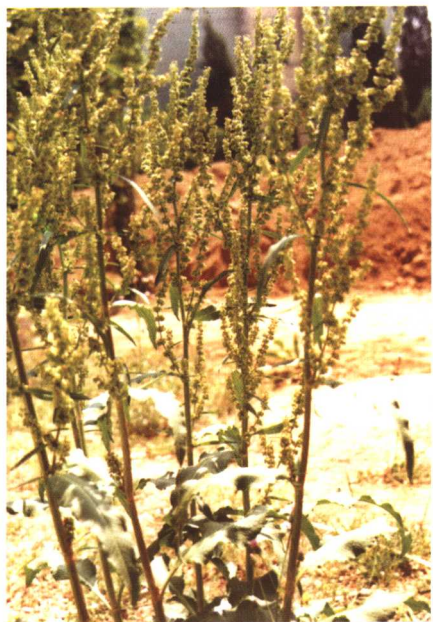
彩图 14 巴天酸模