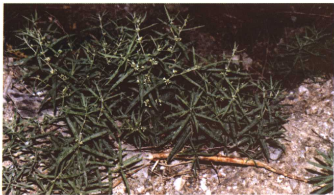
彩图 24 地梢瓜