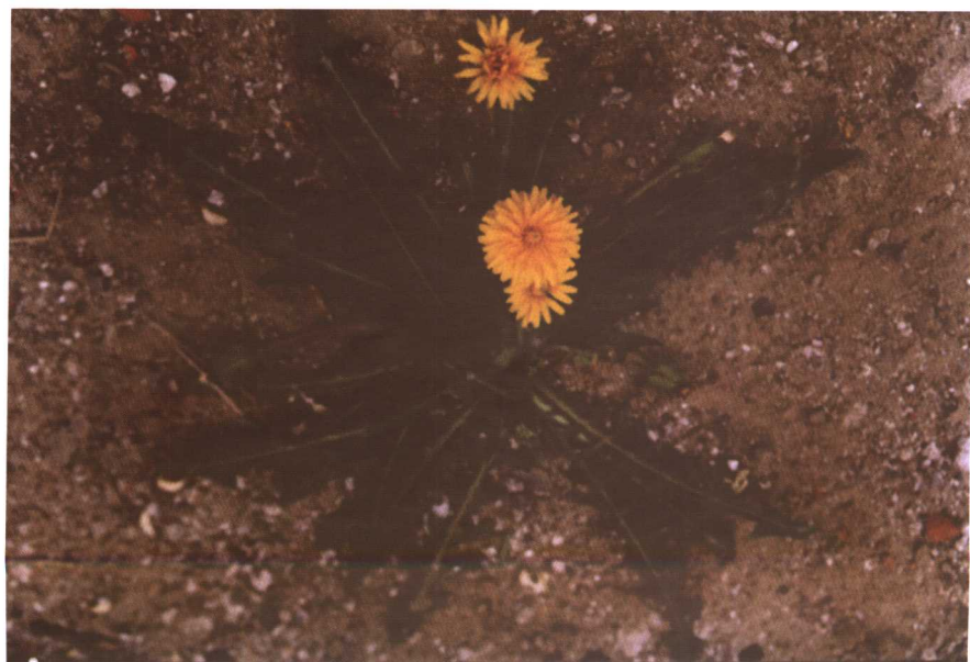
彩图 19 蒲公英