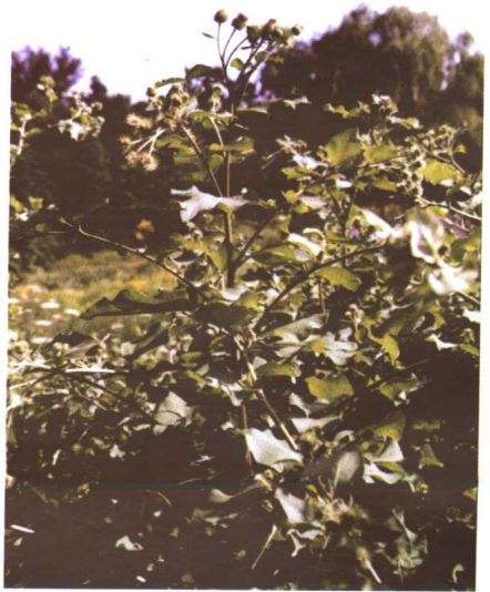
彩图3 牛蒡