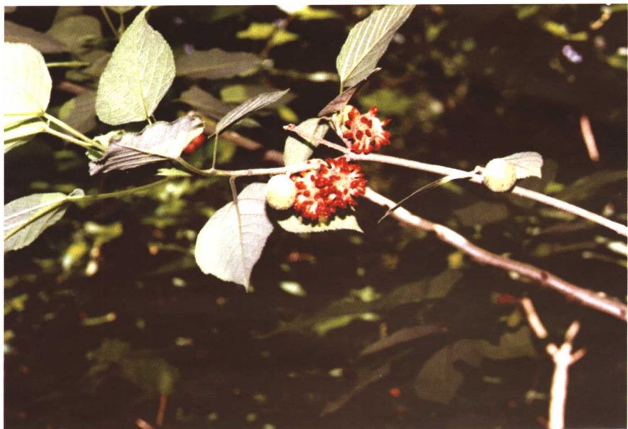
彩图 22 构树