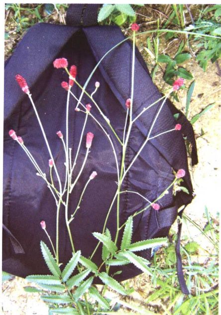
彩图 17 地榆