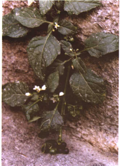
彩图 31 龙葵