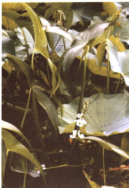
彩图 15 野慈姑