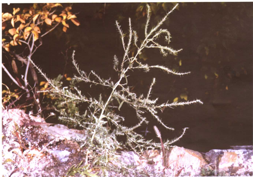
彩图 16 猪毛菜