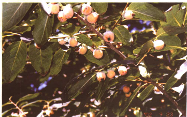
彩图 25 黑枣