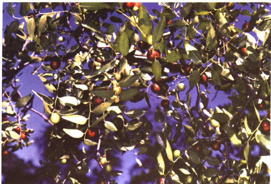
彩图 32 酸枣