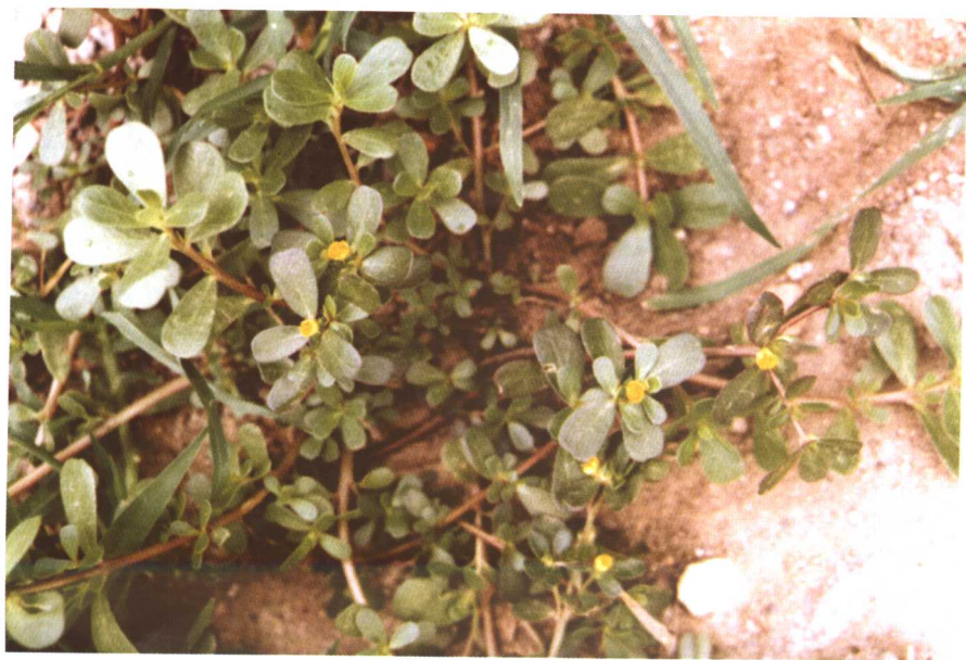
彩图 13 马齿苋