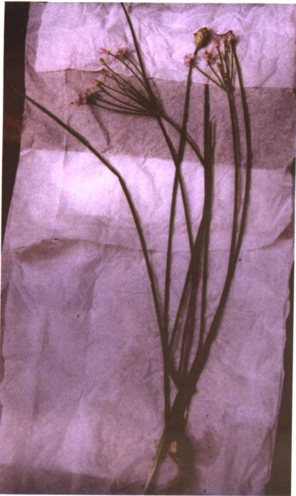
彩图2 山蒜