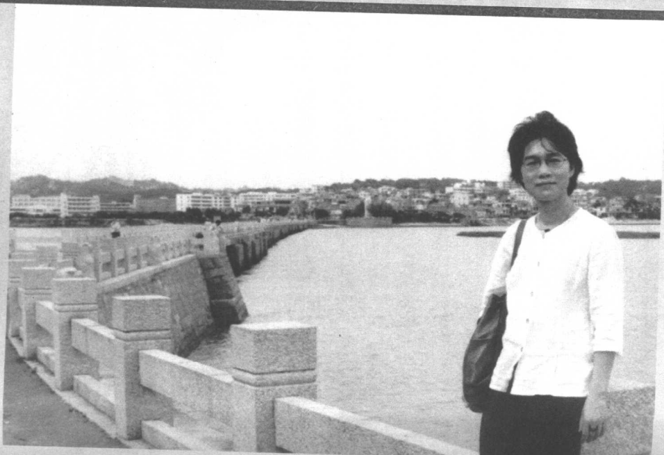
2002年4月在祖籍泉州留影