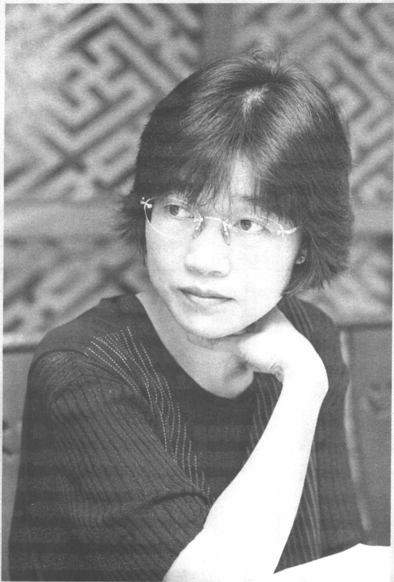
1994年，周旋于创作与出版之间，常有扼喉之感。