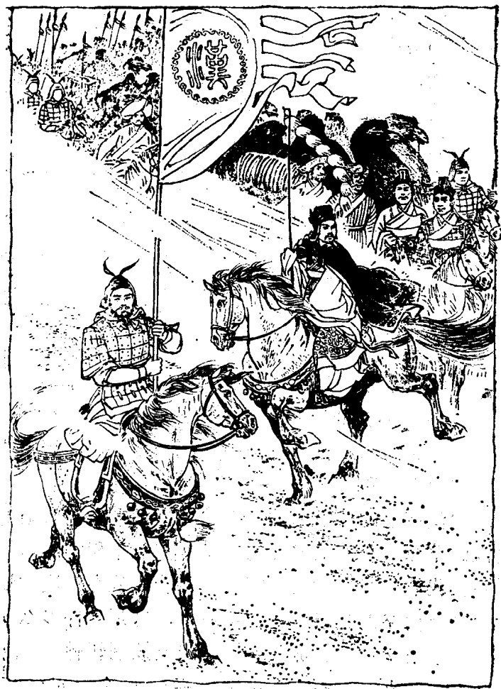
古代丝绸之路上的一个画面。