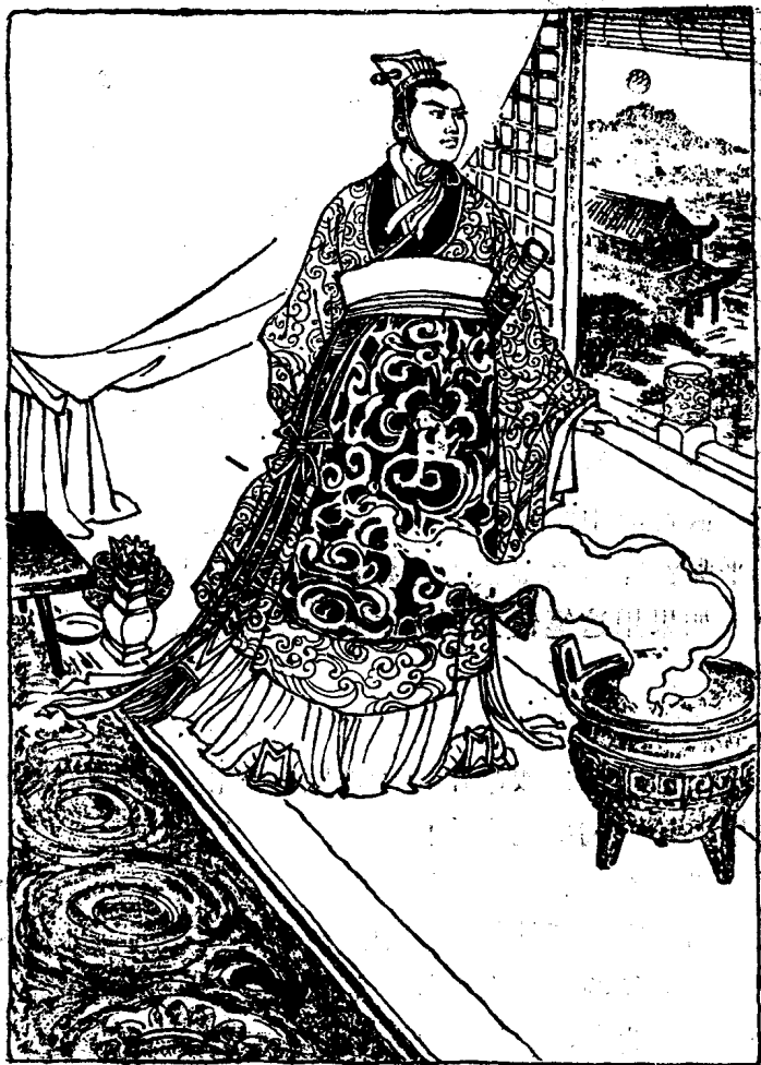
武帝下定决心，反击匈奴！