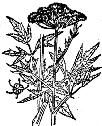
图 1 当归

病人服了煎剂的当归，有抑制体外細菌生长的作用。如服了百分之一的当归煎剂，能增加对伤寒菌、霍乱菌、大腸菌、赤痢菌、变形菌、溶血性鏈球菌和白喉菌的对人体侵袭的抗生力。当归油能鎮靜大脑，并起兴奋和麻