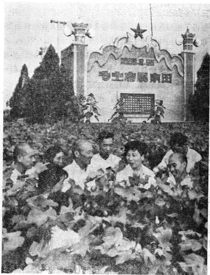
中共新乡县委主要负责同志，深入基层总结学大寨的经验。

么“抓革命保险，抓生产危险”，不敢大胆地用毛泽东思想去解决生产斗争中的实际问题，严重地影响着农业学大寨运动的持续深入发展。为此，县委及时总结了一些大队在处理革命与生产关系上的经验，对大家进行了路线教育。