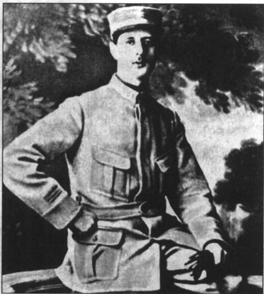
1915年，戴高乐因战绩突出，被授予上尉军衔。

戴高乐在4年的对德战争中，有一半时间是在俘虏营中度过的。对于戴高乐这个血气方刚的爱国青年来说，实在是件憾事。不过，他在很有限的几次战役中，确曾表现十分出色，于是在1919