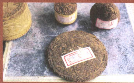
紧压茶、七子饼茶及沱茶