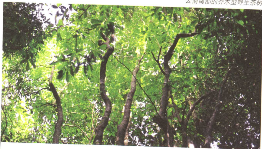
云南南部的乔木型野生茶树

普洱茶近年来同古字画一样进入收藏品之列。收藏普洱茶饼的风气不断蔓延，在云南、广东、福建、香港、台湾及东南亚地区尤为盛