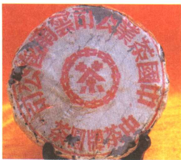
最早生产的“中茶”牌茶饼。佛海茶厂（勐海茶厂前身）建厂后只生产一批，因抗日战争被迫停厂，此批茶在香港是珍藏品

普洱茶是文化的茶，也是有经济价值的茶。普洱茶当有一个标准，这有利于云南普洱茶的品牌。如果文化和经济“嫁接”，那将会是怎样的一种效果？