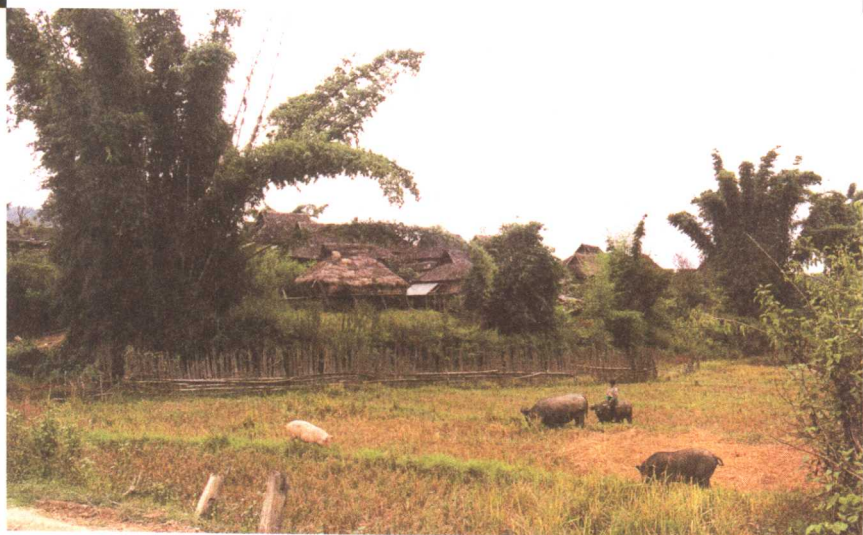
西双版纳的傣族家园

含物丰富的特点，是优良的茶树品种。采摘后的茶叶经过自然天成的加工制作和多次不规则陈化，于是，名驰中外的普洱茶便诞生了。