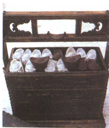
装元宝茶的贡茶箱

我国的茶道大师陆羽就擅长对茶好坏的鉴别，他特别强调茶生产的自然环境。他在其流芳百世的大著《茶经·茶之源》中这样说：种