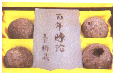
云南输送到西藏的茶