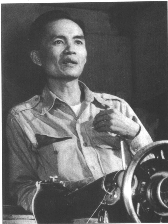
路易斯·塔鲁克，反日领导，又是著名的“胡克”左翼游击运动的领导，他在他兄弟在马尼拉的裁缝店向他的追随者发表演说。塔鲁克在1946年被选进菲律宾国会，但是由于他是一个共产党人而未能担任公职。

被别人称呼的，由当地的共产主义者组织和领导，他们长期以来主要利用乡村菲律宾人对富裕地主的憎恨来进行斗争。在通常不成功的对日攻击之间，人民抗日军也袭击大庄园主——杀死工头和经理。