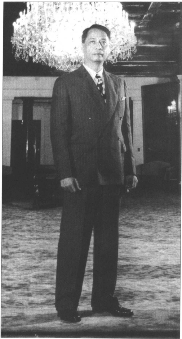
1946年7月，罗哈斯站在马尼拉总统府华丽的接待室里。虽然罗哈斯在日本占领下只担任了一个低级的行政职务，但是他在这个新独立的菲律宾共和国的总统选举中得到了麦克阿瑟将军和有影响的菲律宾人的支持。

菲律宾人对合作逐渐形成一个值得注意的态度，他们推定那些在傀儡政府中接受职务的人之所以这样做，是为了成为日本人和日本人控制的易受伤害的人民之间的缓冲器。最后，日本人发现合作是不可信的，他们怀疑有些傀儡政治家在秘密地帮助地下组织，其中包括一个叫做“胡克”的组织（意思是“人民抗日军”）。人民抗日军（胡克），正如他们