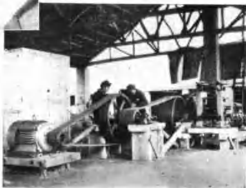
公社号軋鋼机全貌