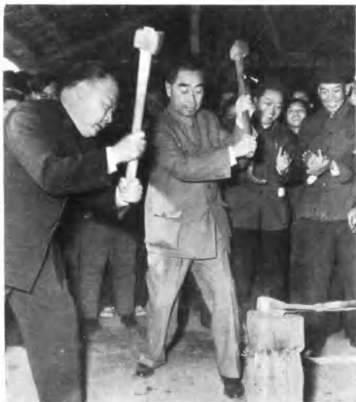
周总理、陈毅副总理视察麻城凤凰窝 钢铁厂时亲自锻钢的情形