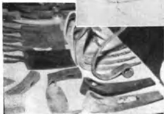
用土鋼制成的各種農具