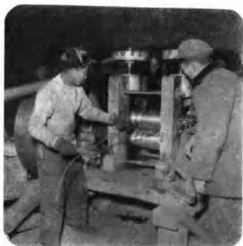
工人們正在軋圓鋼條