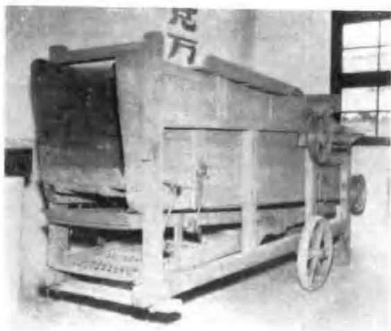
用土鉄土鋼制成的碾谷机