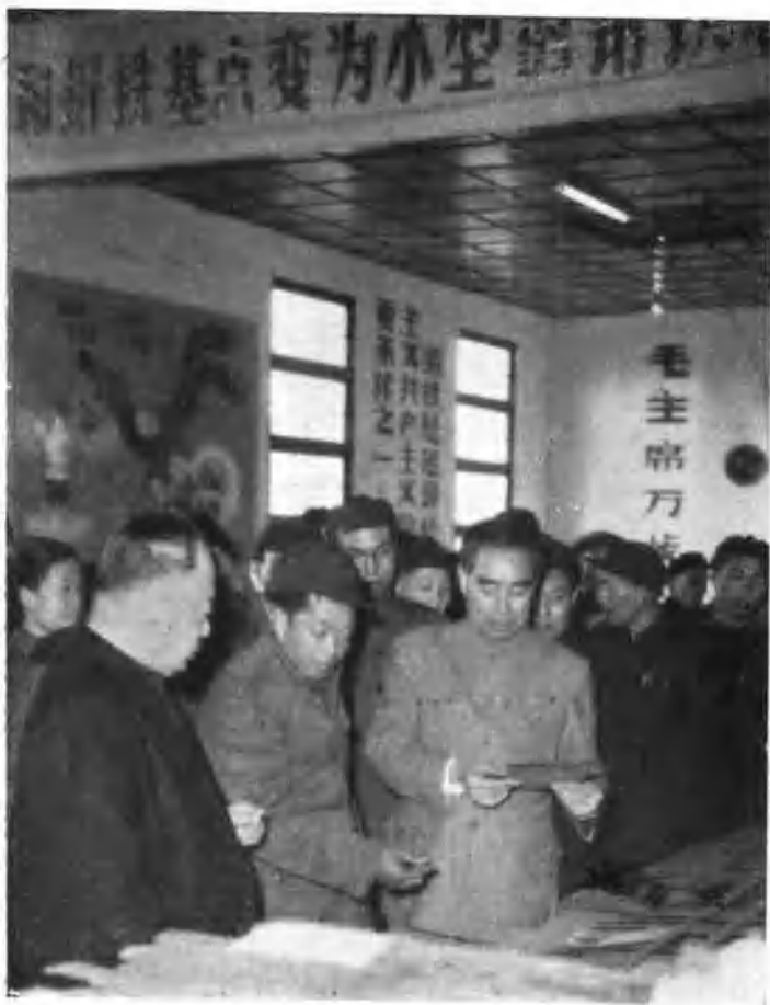
周总理和陈毅副总理，在全国钢铁小土联麻城现场会议期间，于1958年12月13日亲临麻城视察了钢铁小土联。这是周总理、陈毅副总理在参观麻城土铁土钢成材成器展览会的情形