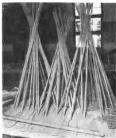
用土鋼軋成的鋼材