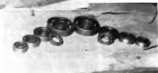
用土鋼制成的滾珠軸承