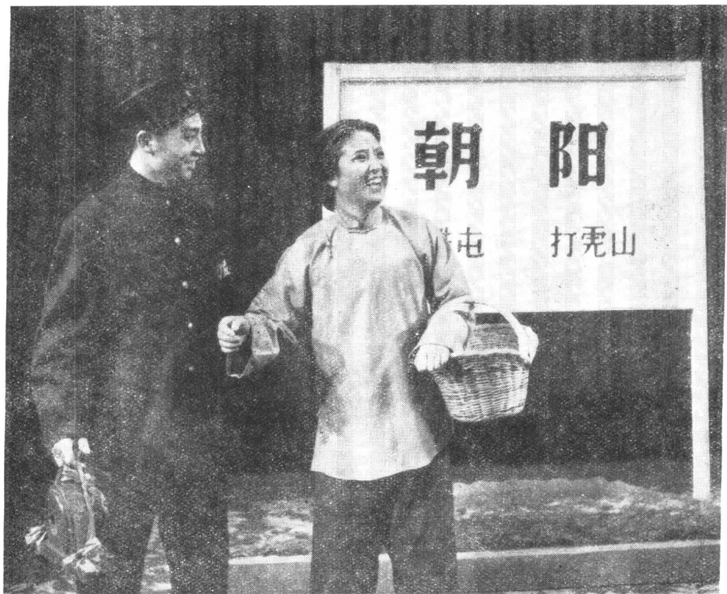
长春市京剧团剧照