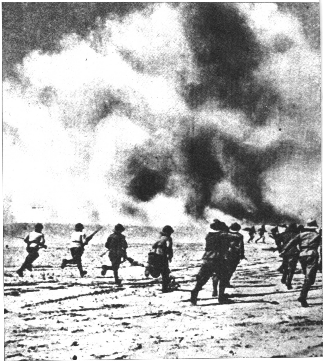
1940年12月,意大利步兵正冒着炮火,在跨越西部的沙漠中冲锋,进攻英军的阵地。但这样的英勇场面已经很难阻止住英军的反