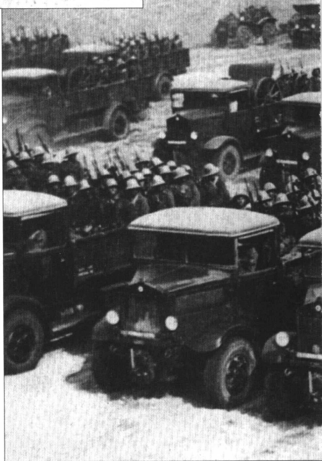
兰西亚卡车车队，里面载满了意大利步兵。他们正在沙漠上跋

风暴终于在12月9日来临。英国人已经利用这段时间积聚力量，他们发动了一次反攻，而意大利人则突然晕头转向了。