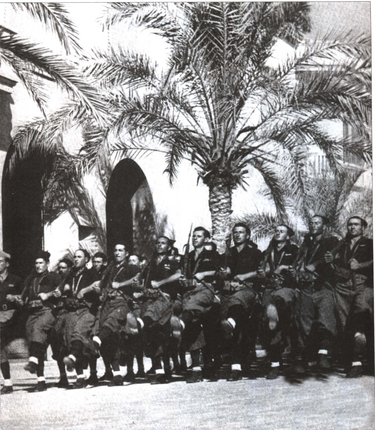
整齐骄傲的意大利黑衫队正列队游行,向1940年8月14日即将返回利比亚前线的格拉兹阿元帅致敬。