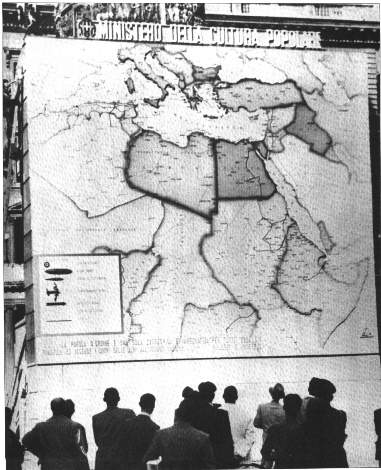
一个工人正站在梯子上添加意军最新进展的图标，罗马的行人在浏览这个地图，追踪意军在北非的成功。