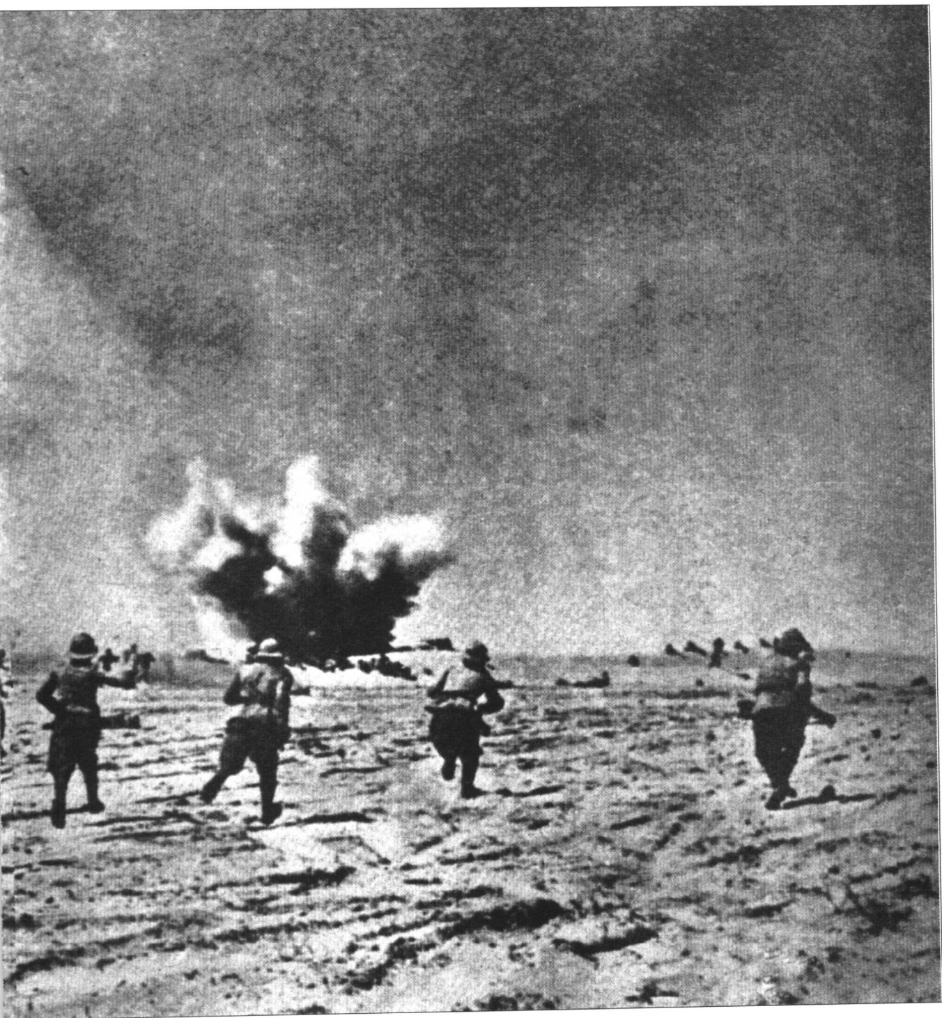
攻。在西迪·巴拉尼,三个意大利师被歼灭,英军随后又攻占了意大利的据点巴迪亚。