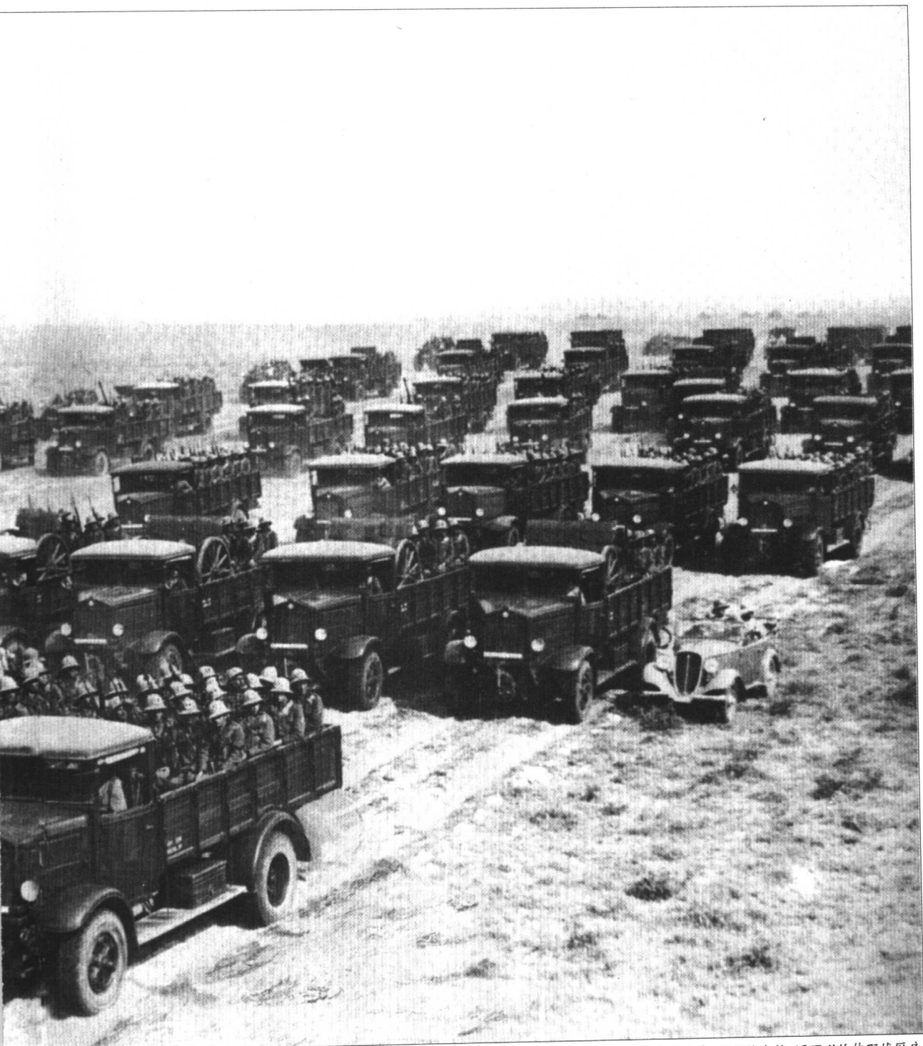
涉,等待继续前进的命令。军官则坐在一辆敞篷小汽车上(右),而图片左侧远处的那辆有大轮子的汽车是拖车,可以拖大炮,还可以拖拽野战厨房。