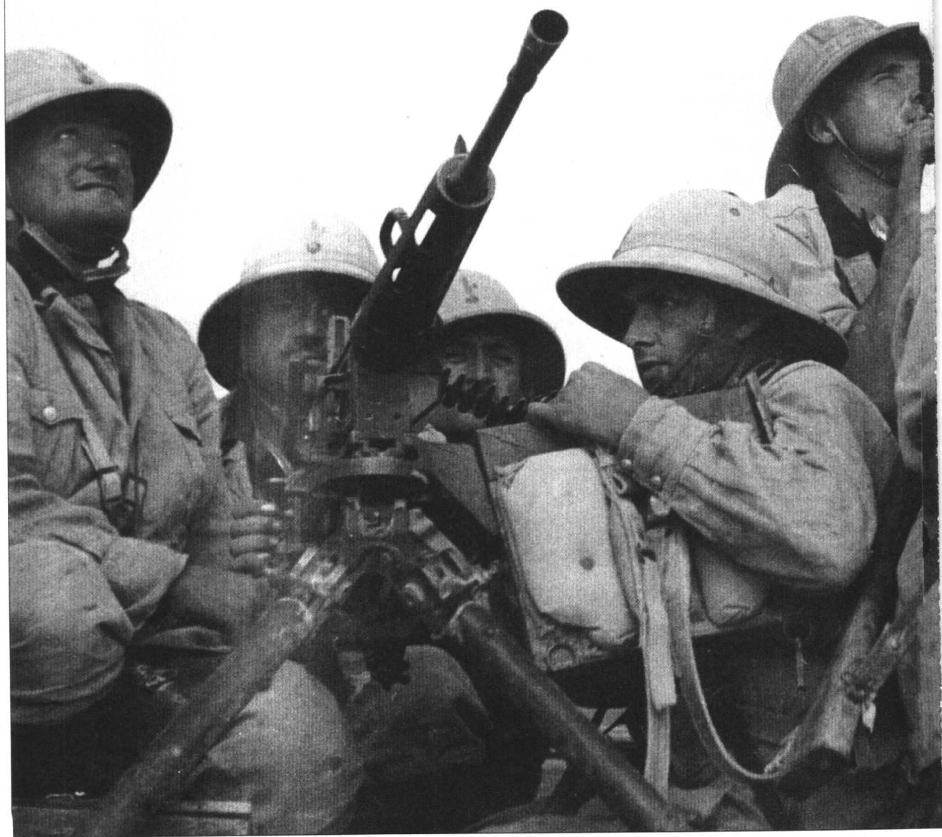
意大利人试图攫取荣耀