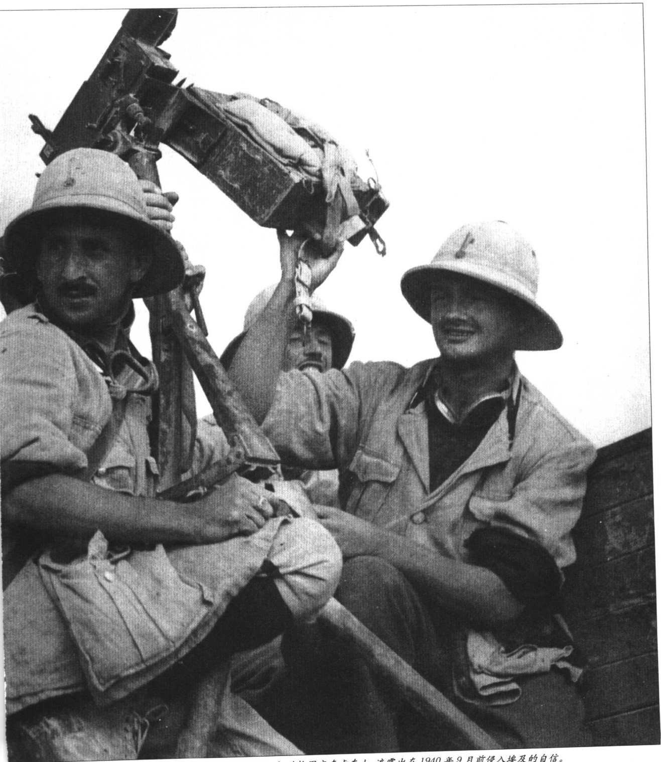
驻扎在利比亚的意军防空部队，身着潇洒的军服，机关枪固定在卡车上，流露出在1940年9月前侵入埃及的自信。