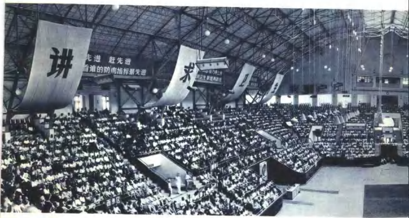
大唱雄壮，大讲声势，大除四害，大讲卫生。这是北京市除四害讲卫生动员大会。