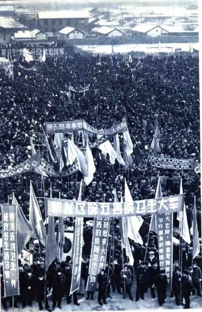
西安市除四害誓师大会