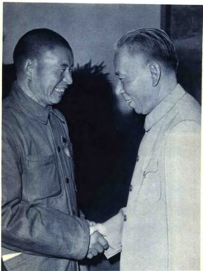
刘少奇主席和模范清洁工人时传祥会见