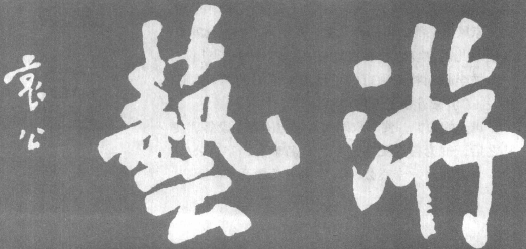
李叔同的早年书法，魏碑风格的洒脱运笔中，是“游于艺”的感性生命态度。