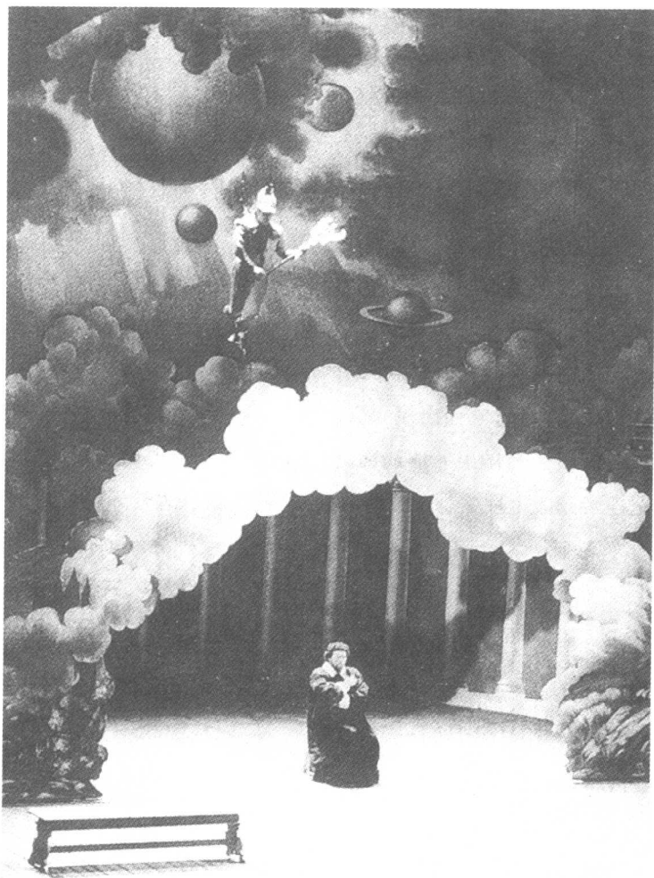
卡罗柯洛波拉演出《波佩阿的加冕》的剧照。